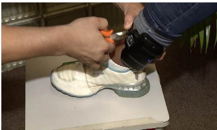
Foto 1 – Instalação de tornozeleira eletrônica. Técnico UGME e monitorado – Fonte: UGME/DAL/SSP/SUAP/SEDS.

de acompanhamento. Antes de passar ao relato dos mesmos, no entanto, é importante pontuar que, ao chegar à UGME, o monitorado é encaminhado primeiramente à antessala, onde passa por uma ‘triagem’. O funcionário (agente de segurança prisional), já de posse de cópia da decisão do juiz (recebida por e-mail previamente), faz seu registro no Sistema Integrado de Informações Penitenciárias – INFOPEN e depois o encaminha a outro funcionário (também agente de segurança prisional) para instalação da tornozeleira. Após esses procedimentos, o monitorado é atendido por um dos técnicos do ‘Psicossocial’, onde passa por uma ‘sensibilização’ (que não deve ser confundida com ‘atendimento psicológico’), momento em que lhe são apresentadas as regras da ‘Unidade Prisional de Monitoração Eletrônica’ e, ao final, recebe uma cartilha com instruções sobre como utilizar a tornozeleira. As imagens a seguir ilustram esse momento.