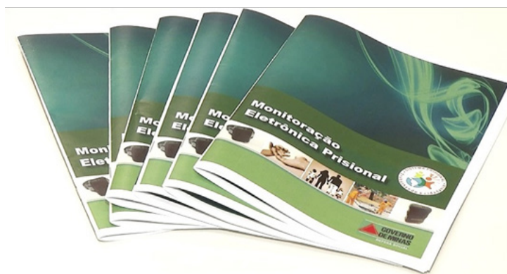
Foto 3 – Cartilha ‘Monitoração Eletrônica Prisional’ – Fonte: UGME/DAL/SSP/SUAP/SEDS.

Segundo um dos profissionais do serviço ‘Psicossocial’, cuja experiência com o sistema prisional mineiro soma quase trinta anos, “[o trabalho com a monitoração] é um trabalho muito similar ao das penitenciárias, (...) porque você lida com presos também; presos que estão numa unidade de benefício já mais alta onde ele já pode, por exemplo, pegar o regime aberto, com saídas temporárias e tudo, e ele pode cumprir na própria casa dele sendo monitorado” 2 .