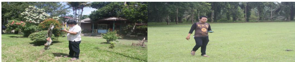
Gambar 2 Kegiatan Pengukuran

Berikut adalah gambar dari kegiatan pengukuran sinar matahari.