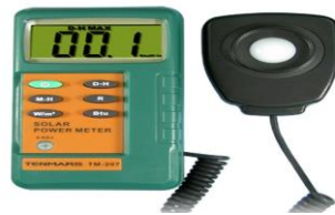
Gambar 1 Solar Power Meter TM-207

pertanian, fisika dan laboratorium optik, pengukuran radiasi matahari, pengukuran transmisi solar, penelitian tenaga surya, identifikasi jendela berkinerja tinggi, membantu memasang Panel Surya Surya pada sudut kejadian yang optimal, dan Light Intensity Measurement untuk jendela mobil [8] . Data didapatkan dengan kegiatan pengukuran langsung yakni dengan mengarahkan remote sensor pada solar power meter ke arah matahari. Kemudian dilakukan pembacaan dengan melihat nilai maksimum dan minimum melalui tampilan layar pada solar power meter [9]. Untuk pengolahan data hasil pengukuran sinar matahari akan dilakukan setelah seluruh kegiatan pengukuran selesai dilakukan. Berikut adalah gambar dan spesifikasi Solar Power Meter TM-207 [10].