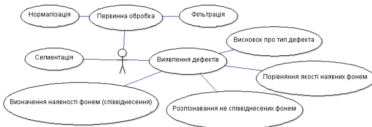
Рисунок 1 – Діаграма варіантів використання інформаційної технології

Структура інформаційної технології. Виявлення дефектів мовлення є багатоетапною задачею, яка потребує багатокomпонентної інформаційної технології. Технологія повинна вирішувати задачі первинної обробки даних, фонемної сегментації та набір алгоритмів виявлення дефектів. На рис. 1 наведено діаграму варіантів використання інформаційної технології.