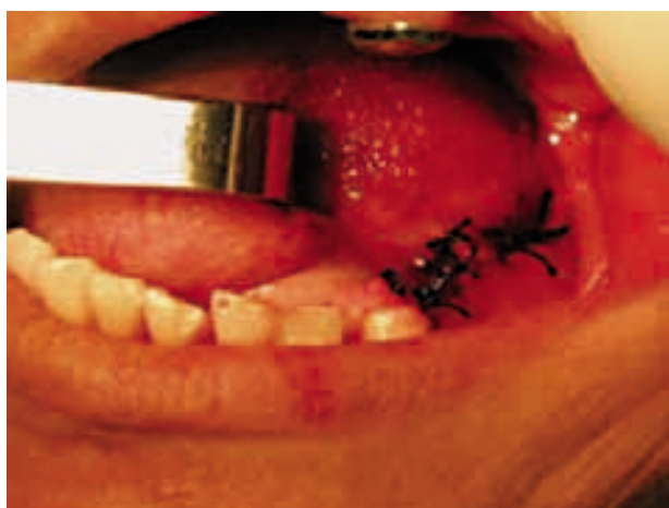
Figura 9. Control postoperatorio a los 2 días.