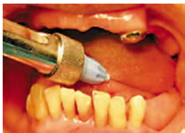
Figura 2. Anestesia local y infiltrativa.

Se realizan los controles respectivos a los 2 y 9 días de la intervención, observándose una evolución favorable (figuras 9 y 10).