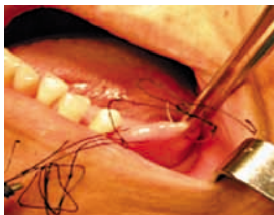
Figura 4. Puntos de sutura simple.