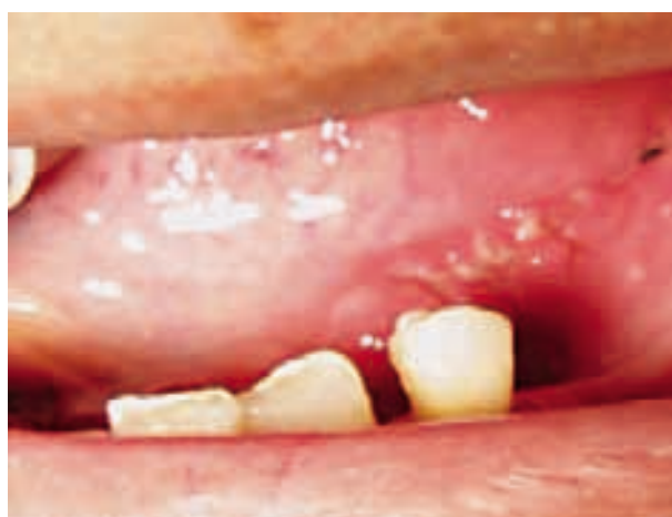
Figura 10. Evolución favorable de la herida operatoria a los 9 días.