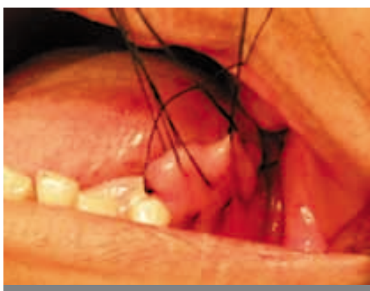
Figura 5. Levantamiento de la hipertrofia sublingual.