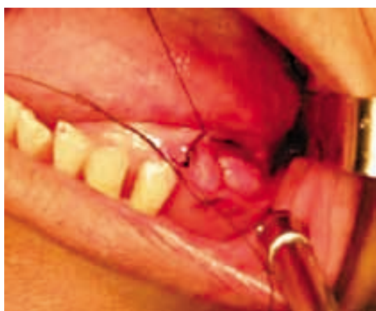
Figura 7. Sutura de la zona intervenida.