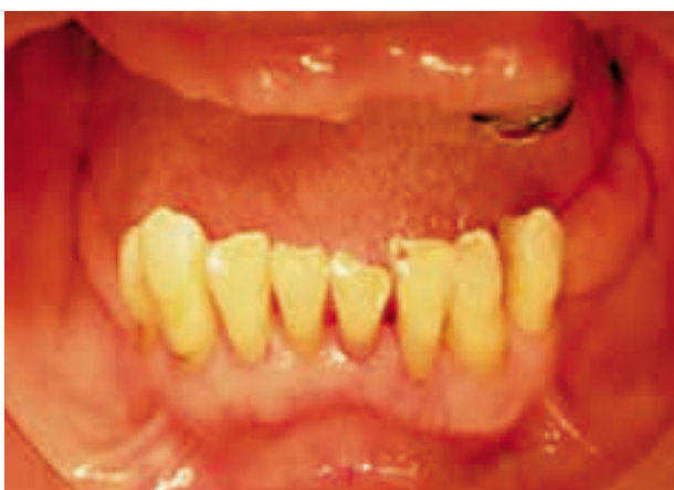
Figura 1. Hipertrofia de la glándula sublingual.

Ante esta situación, se indica la intervención quirúrgica para la extirpación parcial de la glándula sublingual como paso previo a la rehabilitación protésica. Habiendo presentado el paciente su consentimiento informado, se procedió a programar la intervención.