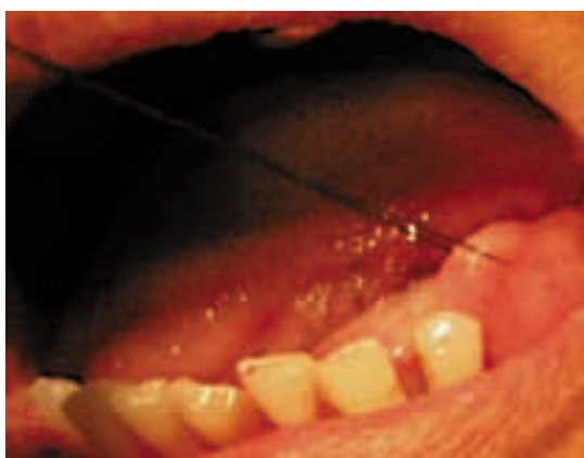
Figura 3. Colocación de los puntos de reparo a nivel de la base de la lesión.