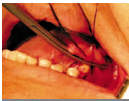
Figura 6. Resección de la hipertrofia sublingual.