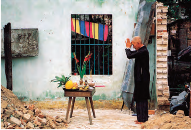
Bønn for innvielse av nytt hus.

kongenes historisitet er høyst usikker. Kongefortellingene er knyttet til legender nedskrevet på 13- og 1400-tallet da man var opptatt av å bygge opp den vietnamesiske nasjon etter å ha gjenvunnet sin selvstendighet fra Kina. 6 Den informasjon legendene gir, må derfor ses i lys av middelalderens behov for å konstruere et ideologisk grunnlag for den nye vietnamesiske selvstendige nasjonen.