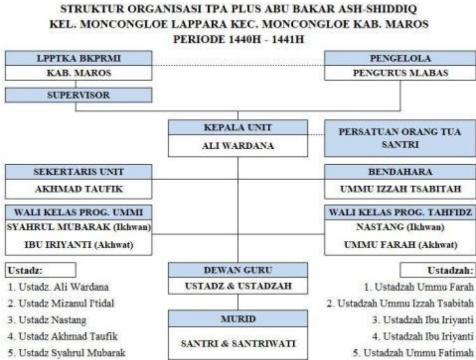
Gambar 4 Struktur organisasi TK/TPA Plus Abu Bakar Ash-Shiddiq