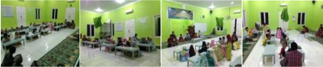
Gambar 7 Pelaksanaan TK/TPA Plus Abu Bakar Ash-Shiddiq dalam bentuk pengajaran membaca Al-Qur'an Metode Ummi kelas klasikal

Kegiatan rutin TK/TPA Abu Bakar Ash-Shiddiq dimulai awal Bulan Agustus 2019. Kegiatan rutin belajar mengaji menggunakan Metode Ummi dilaksanakan setiap hari Senin sampai Jumat setiap pekan antara waktu selesai Sholat Maghrib sampai masuknya waktu Sholat Isya. Selain itu, hari Sabtu kadangkala diisi dengan kegiatan-kegiatan lain di luar pengajaran Metode Ummi, seperti nonton bareng kisah-kisah Nabi dan rasul, kisah-kisah Sahabat, dan materi/kegiatan lain yang bermanfaat bagi santri. Gambar 7 dan Gambar 8 menunjukkan pelaksanaan kegiatan harian TK/TPA Abu Bakar Ash-Shiddiq yang telah berjalan sejak bulan Agustus 2019 sampai saat ini.