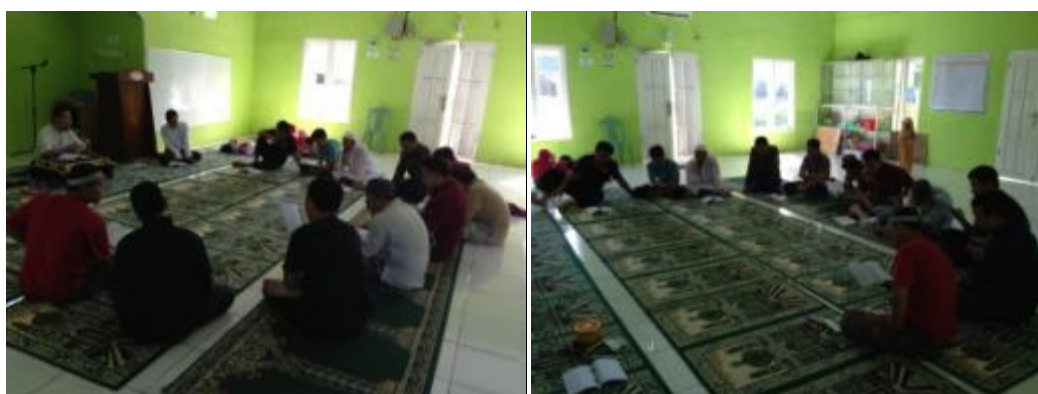
Gambar 6 Pelatihan membaca Al-Qur'an Metode Ummi untuk para guru dan orang tua murid/santri TK/TPA Plus Abu Bakar Ash-Shiddiq (15 Juni 2019)