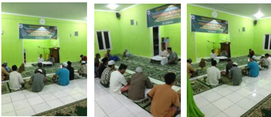
Gambar 4 Pelatihan membaca Al-Qur'an Metode Ummi untuk para guru dan orang tua murid/santri TK/TPA Plus Abu Bakar Ash-Shiddiq (19 April 2019)

Sebagaimana yang telah dijelaskan sebelumnya bahwa metode yang digunakan untuk baca Al-Qur'an pada TK/TPA ini adalah Metode Ummi. Untuk mendukung pelaksanaan Kegiatan TK/TPA dengan Metode Ummi tersebut maka dilakukan pelatihan guru TK/TPA. Pelatihan ini juga sekaligus diikuti oleh orang tua murid/santri. Hal ini dimaksudkan agar proses pembelajaran yang diperoleh di TK/TPA dapat berjalan seirama dengan pembelajaran yang dilakukan di rumah oleh orang tua masing-masing murid/santri. Kegiatan tersebut sampai ini telah berjalan sekitar 2 bulan (sebanyak 10x pertemuan) yang dibawakan langsung oleh Ustadz Qomaruddin, pemegang kuasa Metode Ummi di Makassar. Gambar 4 – Gambar 6 menunjukkan kegiatan pelatihan membaca Al-Qur'an Metode Ummi untuk para guru dan orang tua murid/santri TK/TPA Plus Abu Bakar Ash-Shiddiq. Adapun launching TK/TPA Abu Bakar Ash-Shiddiq telah dilaksanakan pada awal Agustus 2019.