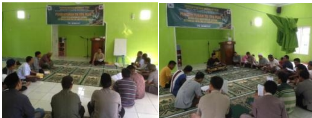
Gambar 5 Pelatihan membaca Al-Qur'an Metode Ummi untuk para guru dan orang tua murid/santri TK/TPA Plus Abu Bakar Ash-Shiddiq (11 dan 12 Mei 2019)