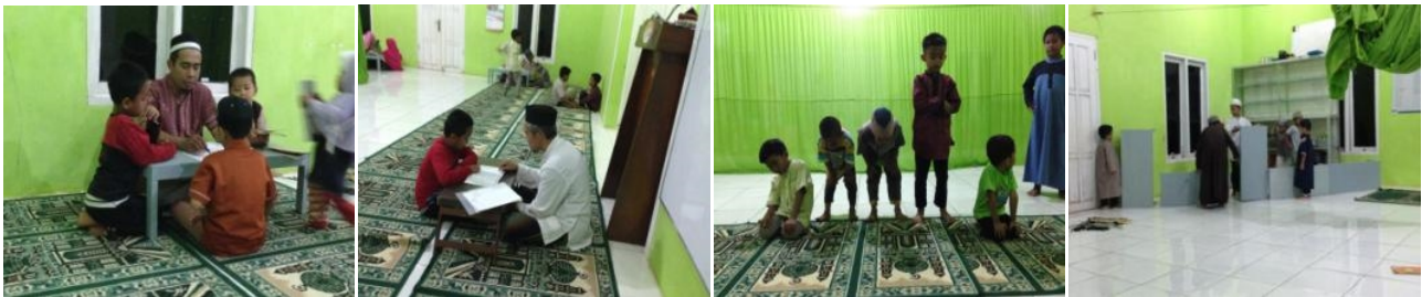
Gambar 8 Pelaksanaan TK/TPA Plus Abu Bakar Ash-Shiddiq dalam bentuk pengajaran membaca Al-Qur'an Metode Ummi kelas privat dan kegiatan lain yang melatih keterampilan santri