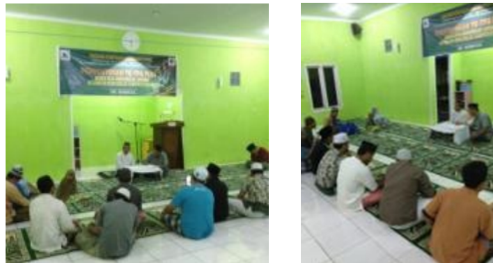
Gambar 3 Foto pada saat dilakukan rapat dengan warga

Pengurus harian TK/TPA Plus Abu Bakar Ash-Shiddiq juga telah dibentuk melalui rapat dengan warga/jamaah masjid. Struktur utama TK/TPA tersebut antara lain: kepala unit, sekretaris unit, kepala tata usaha, bendahara, wali kelas, dan dewan guru. Struktur utama tersebut diisi oleh jamaah yang merupakan warga disekitar masjid Abu Bakar Ash-Shiddiq. Gambar 3 menunjukkan foto pada saat dilakukan rapat dengan warga. Gambar 4 menunjukkan struktur organisasi TK/TPA Plus Abu Bakar Ash-Shiddiq.