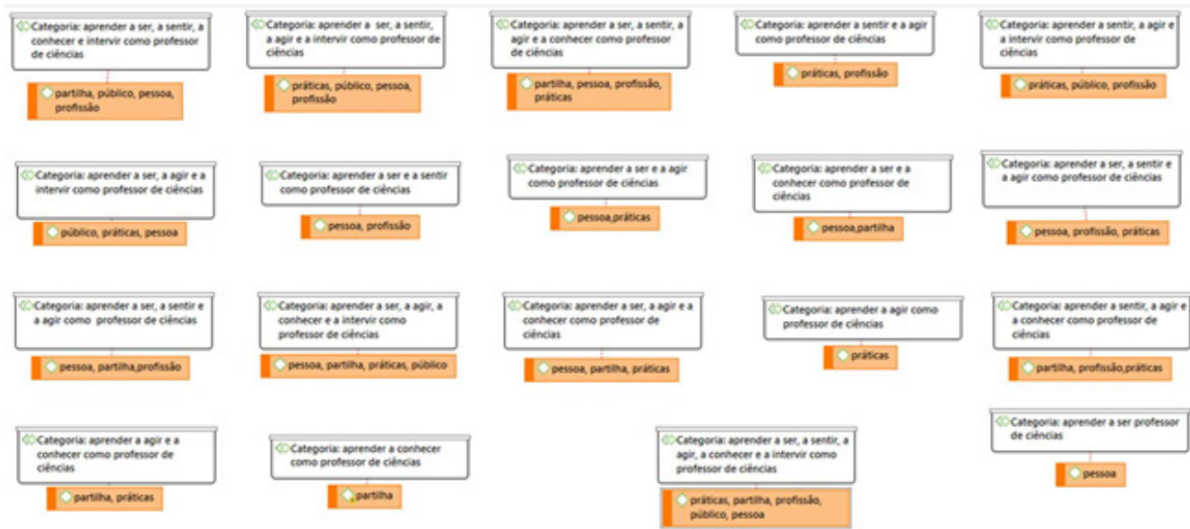
Figura 3. Categorias iniciais, resultantes da análise dos encontros na comunidade autorreflexiva, fundamentadas em NÓVOA (2017).