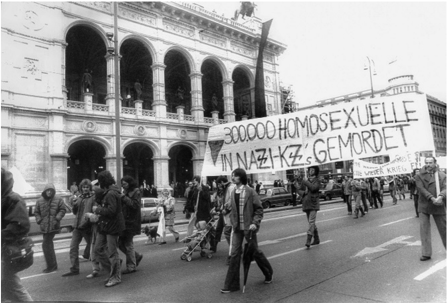
Abb. 1: Demonstration in Wien 1980