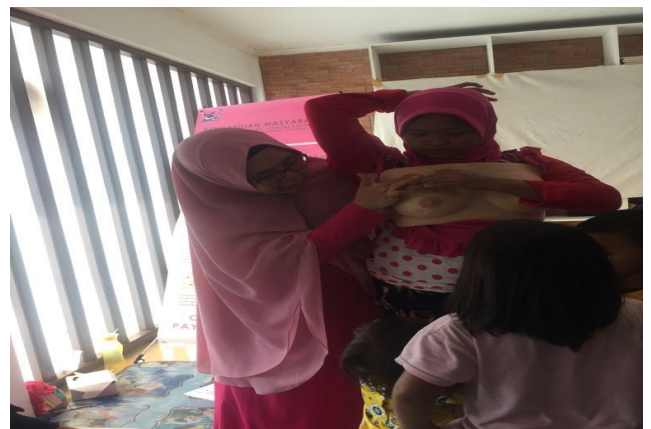
Gambar 3. Peserta Melakukan Praktek

Setelah selesai penyuluhan, kemudian dilanjutkan dengan pemutaran video SADARI. Dengan melihat pemutaran video SADARI tersebut diharapkan informasi yang sudah diberikan dalam penyuluhan lebih dipahami lagi oleh peserta tentang timbulnya penyakit kanker payudara dan bagaimana cara melakukan pemeriksaan payudara secara mandiri.