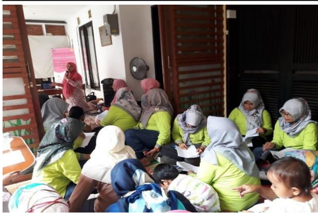
Gambar 2. Kegiatan Pengisian Kuesioner Pretest

Analisa data berupa univariat dengan distribusi frekuensi masing-masing variable (umur, pendidikan, sikap mengenai SADARI).