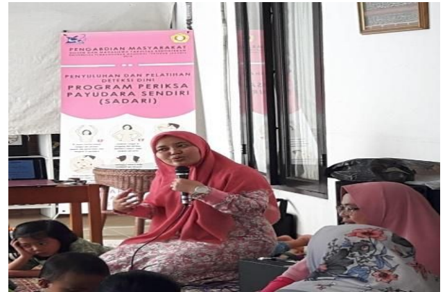
Gambar 1. Kegiatan Penyuluhan

Penyuluhan dilakukan baik secara lisan maupun pemutaran video. Penyuluhan gambaran kanker payudara diberikan dengan menggunakan alat peraga berupa boneka phantom/manekin payudara.