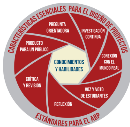
Figura 1. Estándares para el ABPy Larmer, Mergendoller y Boss (2015)

En la Tabla 1, se presentan algunas preguntas que podrían orientar el trabajo alrededor de las características propuestas por el BIE.