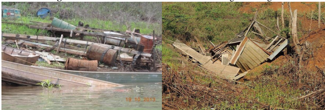
Figura 2 – Tambores e restos de tablados às margens do lago.

As visitas ao Reservatório (cuja permanência, em todas as ocasiões, foi superior a 4 horas consecutivas) revelaram a incipiência de fiscalização pelos órgãos ambientais, fato mencionado pelos pescadores nas respostas ao questionário da pesquisa.