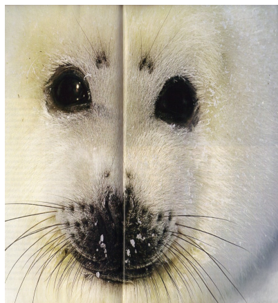
Figura 4. Bebês focas do

Nessas fotografias, a natureza já não vale somente como um objeto ou mercadoria a ser consumida, controlada, manipulada – parte delas está mesmo disposta a denunciar a racionalidade exploratória, do extermínio de focas no Canadá, cobrindo o branco do gelo de sangue à extinção do salmão na China, em rios impressionantemente vazios –, porque a imagem deixa de ser o antigo objeto