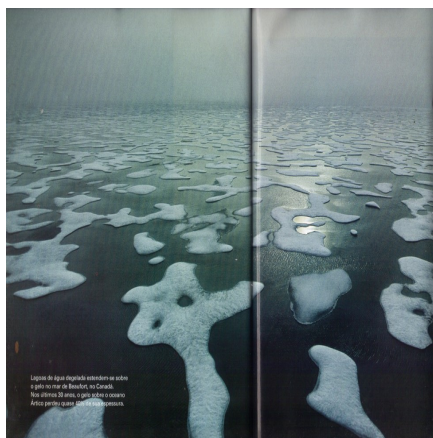
Figura 3. O fim do gelo. Ártico.

Entretanto, nós ainda temos de nos virar em como lidar com um território tão fugidio quanto palpável, tão belo quanto aterrorizante. Mas, ao mesmo tempo, como podemos deixar de lidar precisamente com isso? Quando já não parecem ser mais possíveis ou inteiramente coordenáveis as tradicionais formas de relação com a natureza, é a própria natureza que é visada com seu processo de produzir-se e reproduzir-se. É somente a materialidade da imagem que é capaz de tornar a natureza presente. Só mesmo a imagem estaria apta a inscrever todas as peculiaridades e segredos da mais recôndita vida selvagem por todos os cantos do planeta. Como não pode falar, a natureza é posta no confessionário da imagem, levada a mostrar-se em todas as suas formas. A natureza é “naturalmente” imagética, e é essa sua familiaridade com as imagens que impõe uma garantia de verdade às fotografias. Dubois (1993) ressaltou, certa vez, que a condição do ato fotográfico está na codificação, nos recortes que faz do mundo e do modo como a ele se refere. De fato, como se poderia manter o controle sobre a “vida selvagem” se ela não fosse capturada em todas as suas potências? A imagem da natureza torna-se o próprio Império, sua própria imagem e semelhança: imprevisível, móvel, fluida, flexível, dinâmica, criativa, surpreendente, poderosa.