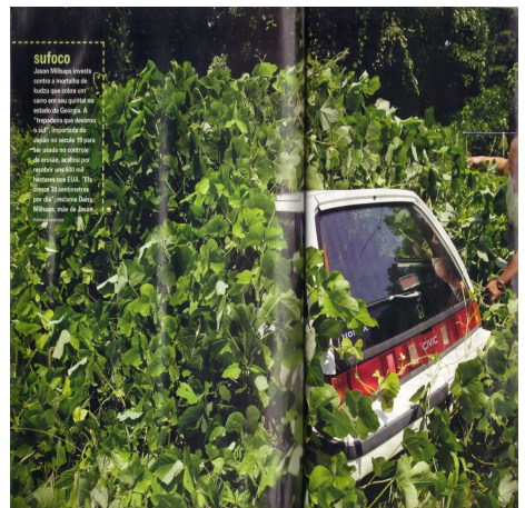
Figura 2. Espécies exóticas invadem o mundo.