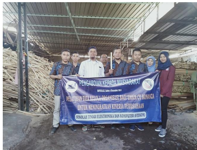
Gambar 4. Penutupan Kegiatan Pelatihan dan Penyuluhan

Hasil dari kegiatan pelatihan dan penyuluhan tata kelola organisasi bagi UMKM CV. Bonanza di Kab. Boyolali, Jawa Tengah dengan beberapa serangkaian kegiatan diantaranya: materi tentang strategi memperoleh pinjaman modal kerja dari perbankan, teknik pembuatan laporan keuangan bagi UMKM, perancangan website pada UMKM, perancangan promotion content pada UMKM, teknik manajemen periklanan, serta perancangan media periklanan. Dengan adanya pelatihan serta