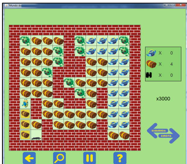
Figure 1: Exemplo do ambiente do jogo

quencial a partir de setas do teclado. No nível médio as setas de teclado são substituídas pelo uso de código-fonte. Já no nível de dificuldade difícil o uso de laços de repetição utilizando características de um jogo é introduzido. A partir da programação de um robô, o objetivo é fazer com que o mesmo chegue até um destino coletando tesouros, evitando alienígenas e desviando das paredes. O aluno pode escolher um nível de dificuldade e em seguida deve escolher um exercício correspondente a este nível. Então é exibido o enunciado do exercício com a descrição de qual é o objetivo do cenário. O ambiente do jogo é demonstrado na Figura 1.