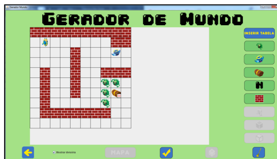
Figure 2: Gerador de mundo

A plataforma também possui uma interface visual para editar os mundos, visto na Figura 2, denominada Gerador de Mundo. O gerador permite desenhar os mapas com os obstáculos, itens coletáveis e inimigos, além de escrever o enunciado do exercício. Contudo, as fases criadas não estão integradas de forma dinâmica com a plataforma, isto é, para que o aluno possa jogá-la é necessário recompilar o projeto pelo ambiente de desenvolvimento gerando um novo executável com a fase. Ainda, não é possível adicionar respostas para os exercícios através do Gerador de Mundo. Logo, para usar o recurso que efetua bonificação aos alunos pela resposta informada é necessário incluir de forma manual todos os nós respostas com seus respectivos valores no arquivo XML gerado ao salvar o mundo.