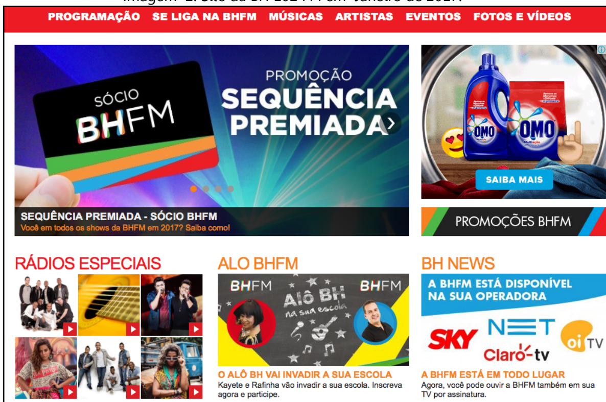
Imagem 2: Site da BH 102 FM em Janeiro de 2017.

demarcadores do ritmo e da intensidade da emissora e da sua programação. Outra questão é a visibilidade do conteúdo tradicional empregado pela rádio, tais como informações sobre a programação musical, mundo do entretenimento, enquetes e participação em promoções. Esta estrutura remonta à potencialização das características de um meio ao se incorporar às plataformas digitais, como indicado por Palacios (2003) e Lopez (2017).