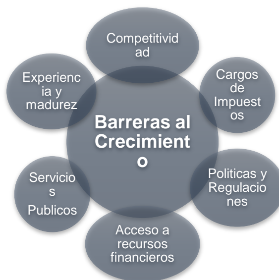
Figura 1. Barreras al crecimiento de las PYME

Por lo tanto, estas organizaciones deben, sin duda, tener las herramientas para hacer frente a todas las demandas sociales, económicas y ambientales (Dominguez, et al., 2015), responsabilidades y roles que se les asignan, ya sean tácitos o implícitos; una tarea que se vuelve compleja, más aún en aquellas que tienen un bajo nivel de madurez en el mercado o que se enfrentan a dificultades internas con respecto a sus procesos de gestión, finanzas, marketing, entre otros (Wang, 2016). Para dar una visión general de estos obstáculos a los que se enfrentan las PYME, la figura 1 resume algunos de los factores más relevantes que impiden el crecimiento de estas organizaciones.