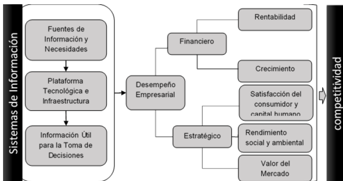
Figura 2. Impacto de los sistemas de información en la competitividad de las PYME