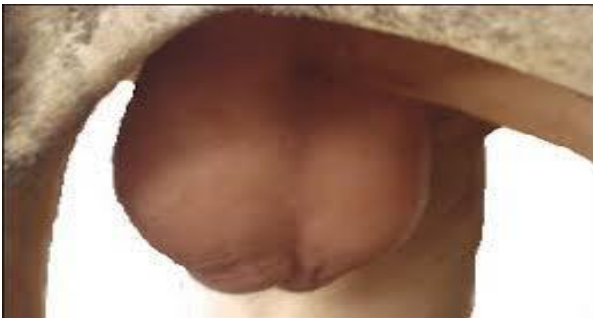
Gambar 2. Pengukuran panjang skrotum

Panjang skrotum menurut (Aurich & Achmann, 2002) diukur dari pangkal sampai ke bawah skrotum menggunakan meteran pada testis seperti gambar dibawah ini.