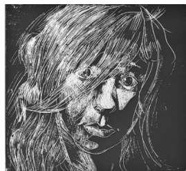
Рис. 5. «Выполнение выпуклой гравюры»

При создании эскиза белым по чёрному к печатной графике (Рис. 4) претерпевают изменения принципы, по которым строится изображение, выполняющее роль подготовительного рисунка к гравюре. В эскизе появляется ряд следующих особенностей: скудость графического языка, полутона отсутствуют, решающим в рисунке становятся линии, а не тушёванные тональности. В одном случае линия как контур, принадлежит форме, в другом – пространству.