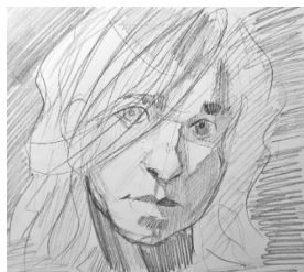
Рис. 3. «Подготовительный рисунок»