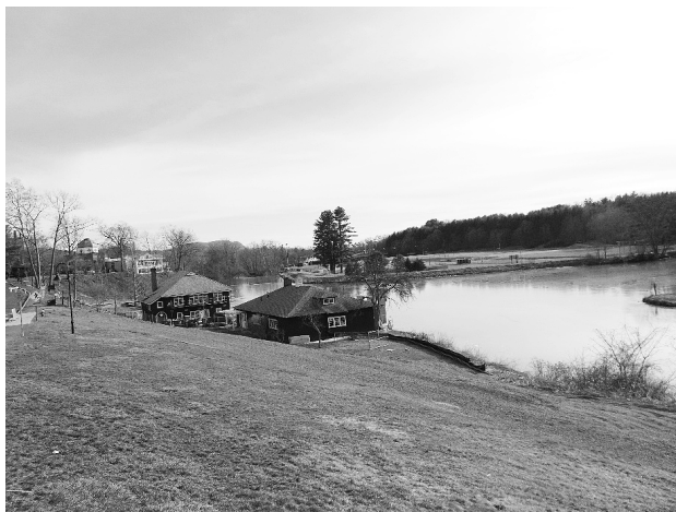
写真 Botanical Garden から Paradise Pond と Athletic Fields を望む (March 13, 2017)