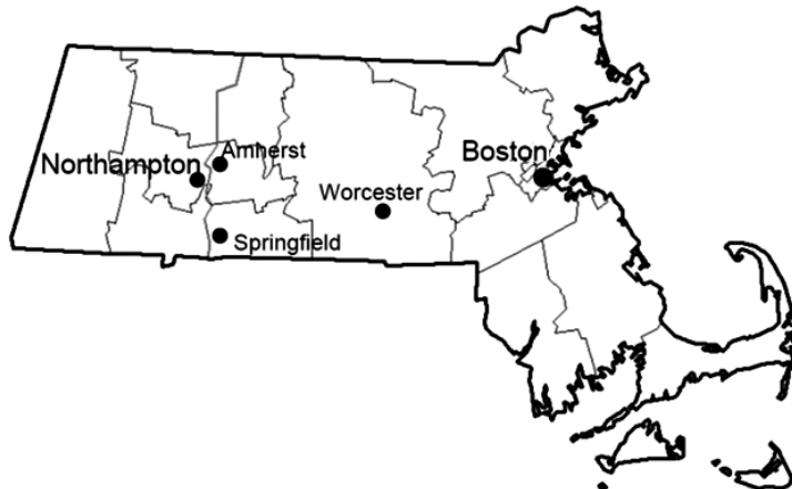
図1. マサチューセッツ州の主たる都市

スミス・カレッジの所在地はマサチューセッツ州西部に位置するNorthampton市で、州都のボストンから車で2時間ほどの距離にある。この街の人口は約28,000名(2017年現在)の、コネチカット川河畔にたたずむ風光明媚な小都市で、全米でも人気が高い街である。人口のうち白人(HispanicとLatinoを除くWhite)が87%と非常に高い比率を占める(suburban stats. 2018)。近隣の街には女子大学であるMount Holyoke Collegeや、共学のリベラルアーツ・カレッジとして有名なAmherst Collegeなどがあり、近くに位置する5大学で“Five College Consortium”を形成し、大学間には無料のシャトルバスが走っている。