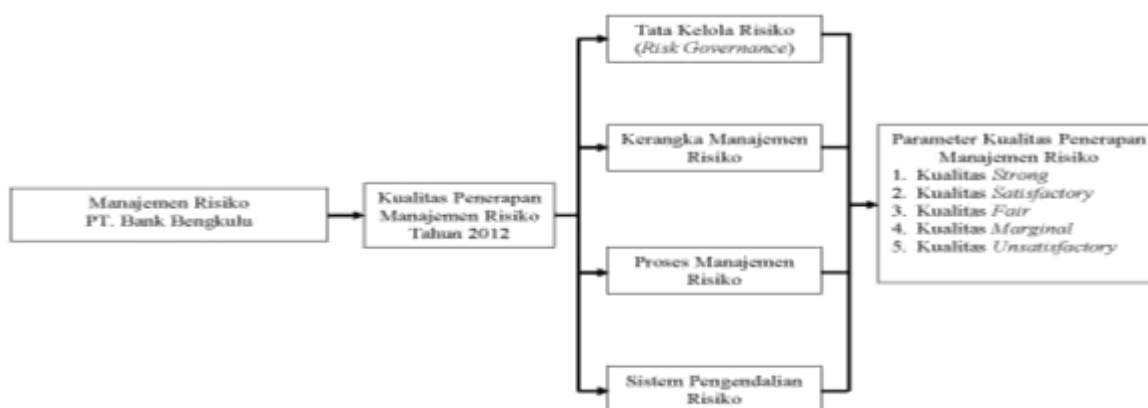
Gambar 2. Kerangka Analisis