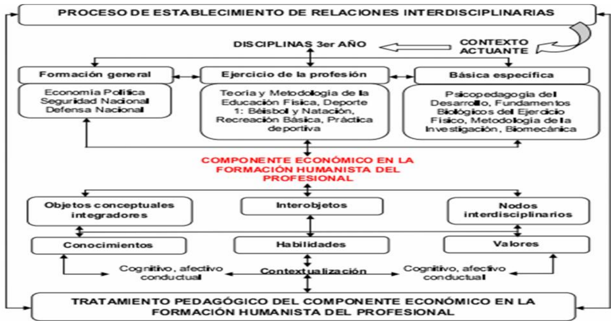
Figura 1. Lógica de la integración interdisciplinaria en el proceso de vertebración del componente económico con las disciplinas en la formación humanista del profesional