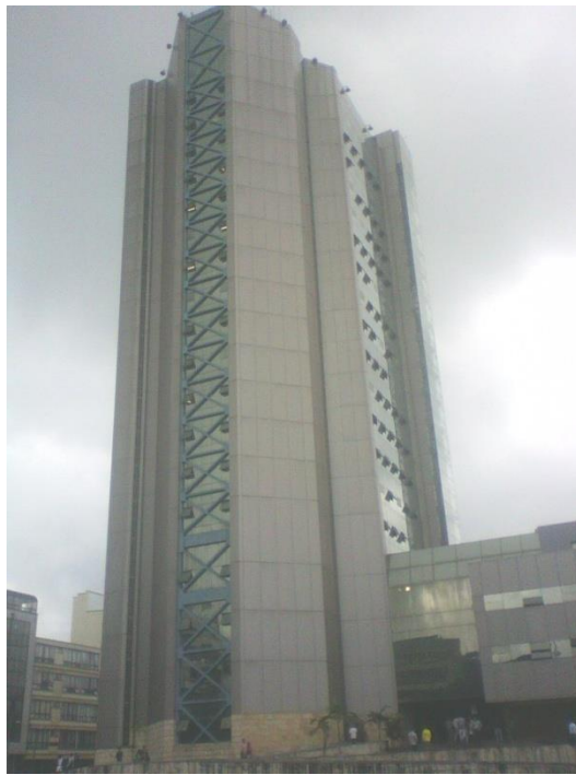
Gobernación del Quindío, edificio emblemático de la plaza