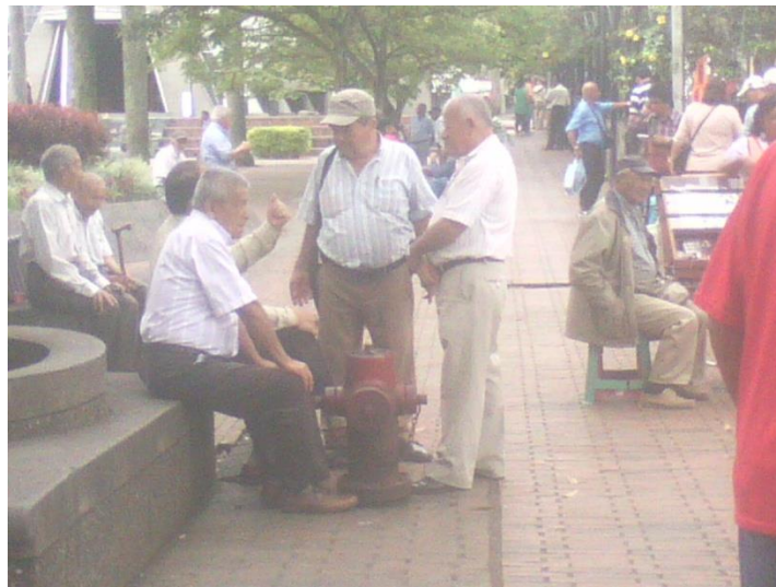
Adultos mayores interactuando cerca a vendedores de tinto