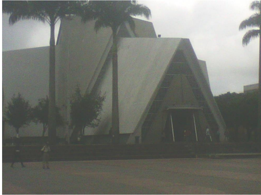
La catedral de Armenia (Q) símbolo religioso de la ciudad