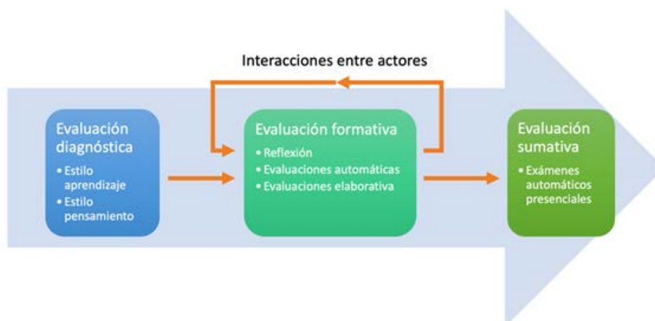
Figura 1 Modelo de evaluación BAOC.

En la figura 1 se muestra el modelo de evaluación BAOC con los tres procesos que lo integran.