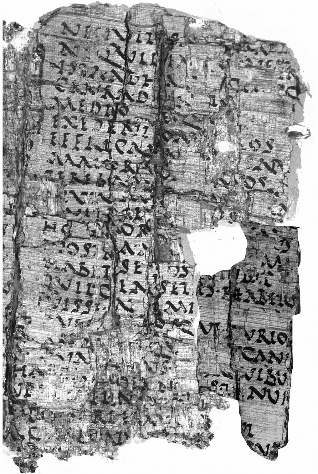
Abbildung 1 PHerc. 1475, cornice 5, rechts