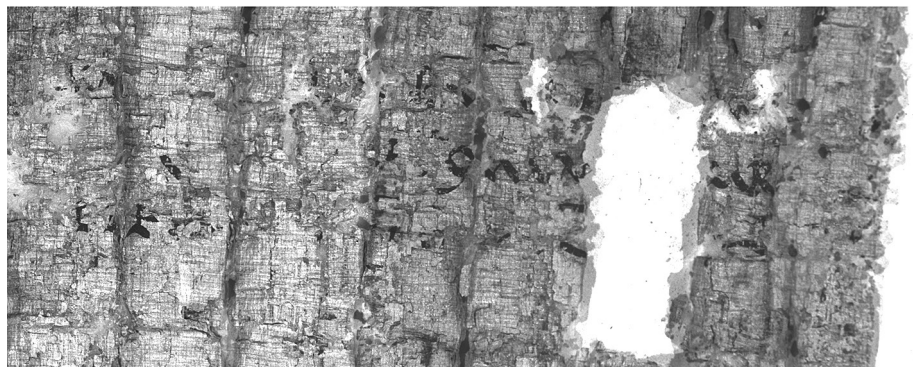
Abbildung 3. PHerc. 1475, N 10 und MSI cornice 7

Die Oberfläche weist einige Sovrapposti auf; der Windungsumfang ist leicht an den hier deutlichen Sektionen zu erkennen. Insbesondere sind die Spuren am Anfang der ersten und der zweiten Zeile jeweils um einen Windungsumfang nach rechts zu verschieben. Der größte Unterschied zwischen der Abzeichnung und dem Original liegt in der Mitte der zweiten Zeile: Wo die Photographie ein o zeigt, findet sich in der Abzeichnung eine fallende Schräge. Zumal gerade