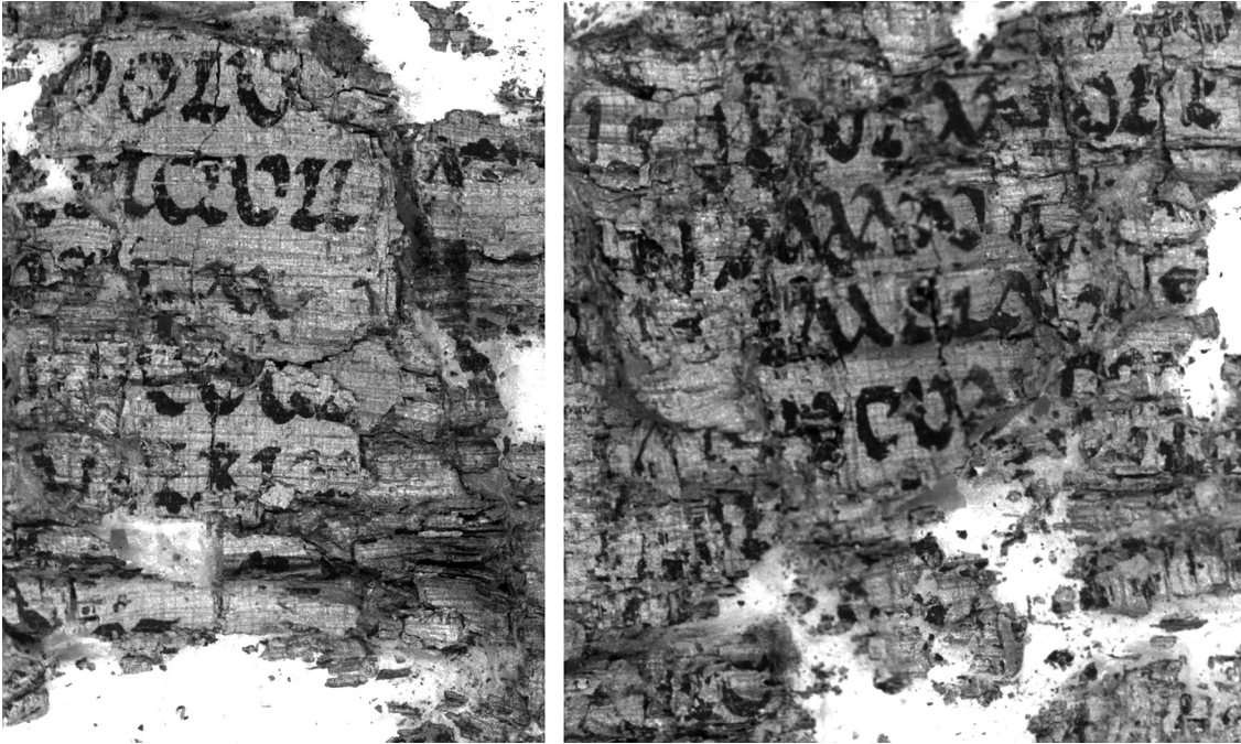
Abbildung 2. PHerc. 1475b, cornice 17

Bereits der erste Vergleich zwischen den untenstehenden Abbildungen (Abb. 1 und Abb. 2) zeigt jedoch, daß der in PHerc. 1475 bei den Buchstaben u und q beobachtete ausgeprägte Kontrast zwischen Haar- und Schattenstrichen, der von einem Schriftwinkel von etwa 40° herrührt, sich in PHerc. 1475b nicht findet. In dieser zweiten Rolle sind Buchstaben runder und mit weniger variabler Strichdicke ausgeführt, obwohl in anderen Fällen (etwa a und m ) wohl ein ähnlicher Schriftwinkel zum Tragen kommt. Zeilenhöhe und Zeilenabstand scheinen hingegen gleich, ebenso der Serifenschmuck. Die wenigen Buchstaben, die sich aus PHerc. 1475b gewinnen lassen, sind am Ende als Anhang abgedruckt.