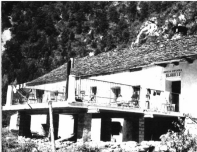
Figura 2. De izquierda a derecha y de arriba a abajo: estaciones manuales de Las Cortes (P), Fanlo (P), Pineta presa (TP) y Bujaruelo (P).