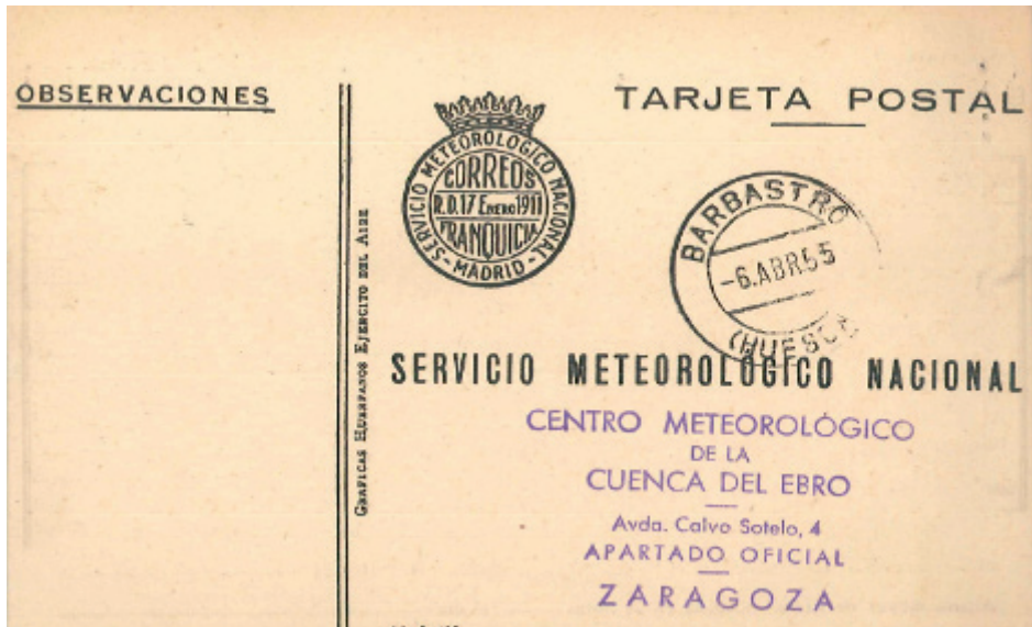
Figura 1. Tarjeta de anotación de datos de observación en 1970.

La figura 1 muestra un ejemplo del formato de las tarjetas con los datos de observación enviadas al centro de referencia.