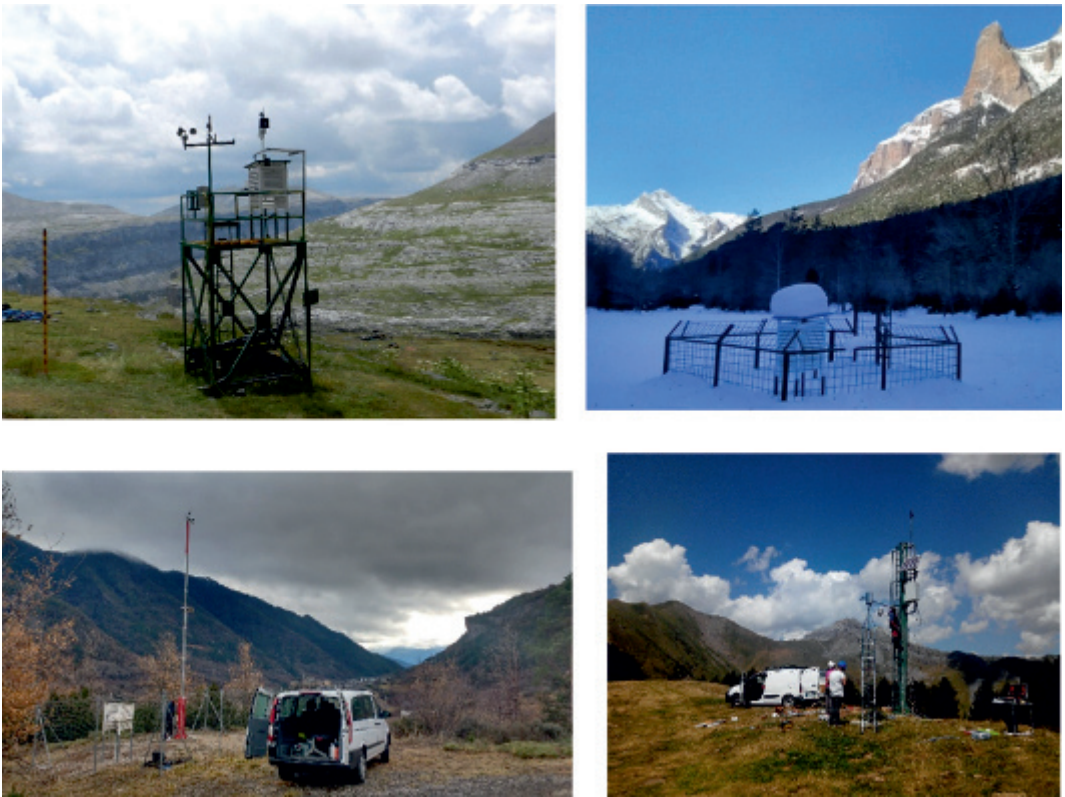
Figura 4. De izquierda a derecha y de arriba abajo: las estaciones del refugio de Góriz, Ordesa-Pradera, Torla-Depósito Automática y la estación automática de alta montaña de El Cebollar.

Otra mejora ha sido la posibilidad de añadir en la observación nuevas variables meteorológicas que antes no era posible obtener de una manera eficiente como el viento, la humedad, la insolación o la presión atmosférica. La posibilidad de un contacto más instantáneo con los colaboradores ha permitido que la comunicación sea más eficiente a la hora de gestionar incidencias o supervisar los datos. Quizás se haya perdido parte de ese romanticismo y emoción de recibir o enviar una carta.