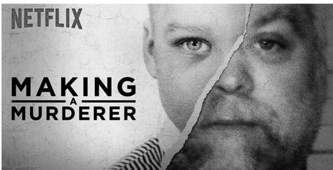
Publicidad de Making a Murderer .