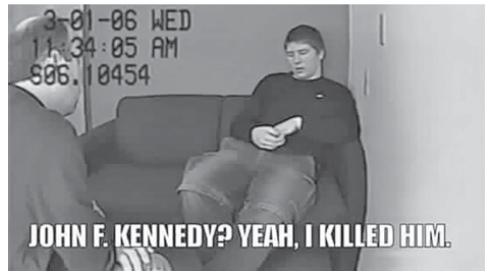
Foto fija remezclada del interrogatorio de Brendan Dassey.

Los autores no aparecen en la serie, pero la voz editorial es evidente en la forma en la que se cuenta la historia: Avery y Dassey son inocentes. Los productores decidieron esto antes de que el público pudiera decidir por sí mismo y esto se hace evidente mediante la forma en que se encuadran las tomas. Esto contrasta con Serial de Koenig, cuyo proceso editorial es obvio, pero genuinamente parece dejar preguntas sin responder. Ambas historias