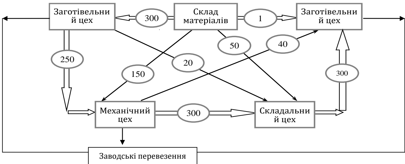
Рис. 1. Типова схема вантажопотоків промислового підприємства (місячний вантажопотік у тоннах)

Приклад ідеалізованої схеми вантажопотоків промислового підприємства за рік показано на рис. 1.