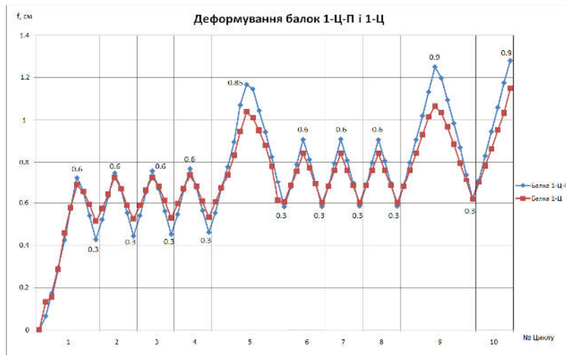
Рисунок 2. Графік деформування балок 1-Ц (до підсилення) та 1-Ц-П (після підсилення) при однакових рівнях навантаження

Як видно з графіку зображеного на рис. 2, лінії деформування балок 1-Ц та 1-Ц-П практично накладаються одна на одну, тобто їхній прогин практично однаковий. Але при цьому за одиницю навантаження непідсиленої балки було взято 1,95 кН, а підсиленої – 4 кН.