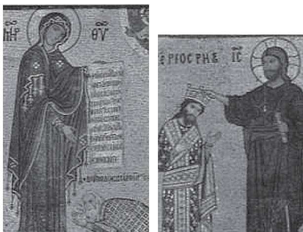
(左) 図4 海軍提督ゲオルギオスによる寄進図 (右) 図5 キリストに戴冠されるルッジェッロ2世

君であるルッジェッロ2世が、キリストから戴冠を受け、彼の権威が神意に叶ったものであることを示す(図5)。2図は彼らの存命中に描かれたが、それほど強い肖像性は有していない 26) 。しかしゲオルギオスの顔貌とマタイのそれは、白髪白髯という定型を共有するとはいえ非常に相似した表現である(図6)。むしろこの場合、ゲオルギオスの顔貌をマタイの定型に合わせて描いたとするのがより適切であろうか。筆者は、「聖母の眠り」に描かれたマタイには、献堂者であるゲオルギオスのイメージが重ね合わされていると考える。それを観者に気付かせるのは、追加された13人目の使徒である。彼の上部に描かれた黒髪黒髯の人物がそれであり、この顔貌はゲオルギオスの献堂図と対をなすルッジェッロ2世の戴冠図を想起させる。観者ははじめに使徒が13人いることに気づき、それは誰だろうかと視線を巡らす。そこで、画面の右端に立つ2人の使徒に注目する。白髪の使徒は確かにマタイであるが、同時に観者が入堂する際に眺めた献堂者ゲオルギオスと同じ姿である。その上部にはやはり入口に飾られたルッジェッロ2世を思い起こさせる黒髪の男が立つ。献堂図でマリアの庇護を約束され、キリストによって戴冠された2人の男が、マリアの臨終に際しその傍に侍っていることを観者は理解するのである 27) 。これは「聖母の眠り」が持つ意味から重要なことである。まず「眠り」はマリアの生涯を締めくくる主題であり、聖母に捧げられたラ・マルトラーナにおいても最も重要な図像の一つと言えよう。また人の身でありながらキリストに手ずからその魂を迎えられ、天へと上がったマリアの死は、信徒に