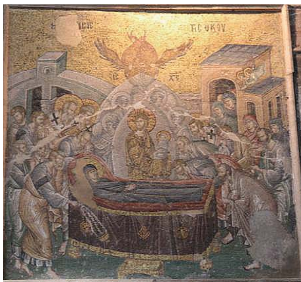
図7 カリエ・ジャミィ イスタンブール、トルコ 1316-21年

せをそこに表現した。本論ではもう一つ、逆に11人の使徒のみを描いた作例を取り上げたい。それは首都コンスタンティノポリス、コーラ Chora 修道院ナオスにモザイクで描かれた「聖母の眠り」である 29) 。1453年の首都陥落後、コーラ修道院はカリエ・ジャミィ Kariye Djami と呼ばれるモスクへ改変され、聖堂内のモザイク、フレスコは漆喰に覆われたが、20世紀に入り漆喰がはがされ、現在はカリエ・ミュージアムとして一般に公開されている。ナルテクス（玄関廊）、ナオス（本堂）はモザイク、副礼拝堂はフレスコで飾られ、14世紀前半の首都の洗練された様式を現在に伝える。「聖母の眠り」は縦横2メートルほどのほぼ正方形のパネル状で、ナオス西壁の扉口上部という定型配置を採る（図7）。構成は中央にキリストとマリア、左右に使徒と主教、女弟子、マンデルラの背後と画面右上空に天使、キリストの上方にセラフィムが描かれる。セラフィムが描かれるのは「聖母の眠り」では珍しい作例だが、後期ビザンティンの作例で多く見られる説話の説明的なモチーフや群衆表現は為されず、ほぼ最小構成で描かれていると言えよう。一見単純な「聖母の眠り」図である本作だが、使徒に注目すると12人ではなく11人となっている。この理由は、マリアの臨終の際にトマスだけが間に合わなかったとする一部の説話を引いているものと思われる。説話の一エピソードを絵画化したのであれば、他にも雲に乗る使徒、手を切り落とされるユダヤ人など、珍しいものではない。カリエ・ジャミィのモノグラ