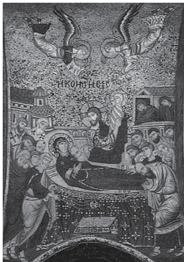
図3 サンタ・マリア・デッラミラーリオ聖堂(ラ・マルトラーナ) シチリア 12世紀中頃

ラ・マルトラーナの「聖母の眠り」は、湾曲した壁面に、金地のモザイクで描かれる(図3)。中央に寝台に横たわるマリア、その奥に赤子の姿をしたマリアの魂を抱くキリスト、周囲を使徒が囲み、上