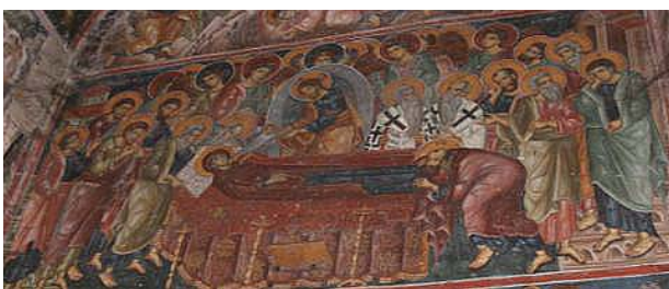
図1 スヴェティ・ニコラ聖堂 ヴァロシュ、マケドニア 13世紀末

スヴェティ・ニコラの例からは、「聖母の眠り」における十二使徒は特にその個別性まで意識されていないことが示唆された。ではここでの十二使徒は、ペテロ、パウロ、ヨハネとその他脇役の使徒、という捉え方で問題ないだろうか。十二使徒とはそ