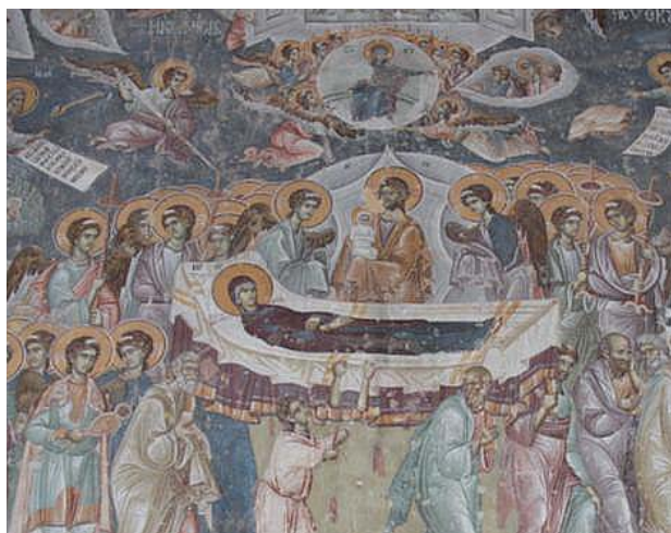
図8 スヴェティ・ギョルギ聖堂 スタロ・ナゴリチャネ、マケドニア 1316-18年

この考えに立つ場合、なぜ腰帯を受け取るトマスという、より具体的なモチーフを描かなかったのかという問題が残る。カリエと同時期のマケドニア共和国、スタロ・ナゴリチャネ Staro Nagoričane のスヴェティ・ギョルギ Sveti Georgij (聖ゲオルギオス) 聖堂には、マリアから腰帯を受け取るトマスが描かれており(図8)、モチーフは既に確立していたと言ってよい 34) 。考えられる理由は、まずカリエの「聖母の眠り」が登場人物を少なくすることで均整のとれた構図を実現しており、メトキティスの美的感覚が余計な図像の挿入を嫌ったのではないか。オフリド、パナギア・ペリブレプトスのように小さな雲に乗るモチーフであれ、スタロ・ナゴリチャネのようにより大きな図像であれ、画面上部は窮屈になり左右対称性が崩れることは避けられない。説明的であるがゆえに煩雑な画面より、語るところが少なくとも均整の取れた画面構成を選んだの