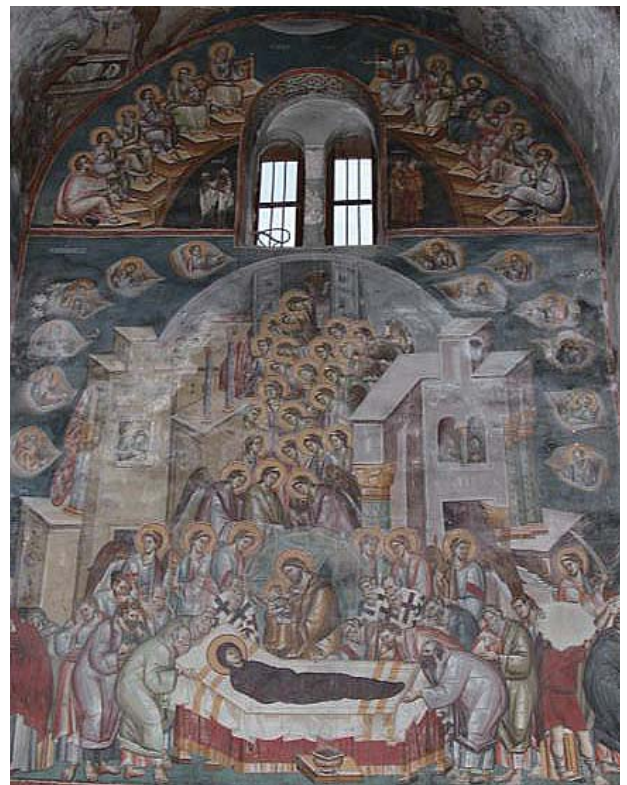
図2 パナギア・ペリブレプトス聖堂 オフリド、マケドニア 1294/95年

「聖母の眠り」はマリアの魂が救われることにより、人類の救済が暗示される図像でもある。キリストは人でありながら神でもあるため天へと昇ったが、マリアはまごうことなき人であり、その人がキリストによって天へと上げられたことは、人類全て