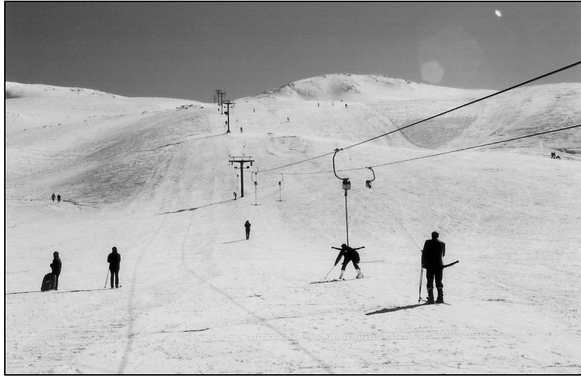
Foto 4. Hazar baba Kayak Merkezinde Kar Kızağı Pisti, Telesky Hattı Ve Kayan İnsanlar

Merkezde Ocak ayı başları ile Mart ayı ortalarına kadar süren kayak sezonunda, sahaya ortalama 2000 araç ve 10.000 ziyaretçi geldiği belirtilmektedir. Ziyaretçiler hafta içlerine nazaran hafta sonlarında ve tatil günlerinde daha fazla gelmektedir. Tatil günlerinde gelen günlük ziyaretçi