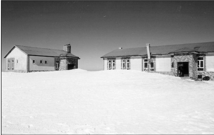
Foto 6. Kayak Merkezinde Günübirlikçilere Hizmet vermek amacıyla kurulan yeme içme tesisleri