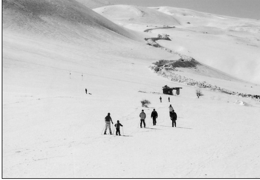
Foto 2. Hazar baba Kayak Merkezi ile Sivrice İlçesi Arasındaki, Ulaşım açısından sorunlu olan 6 km lik yoldan bir görünüm

tutulmaktadır. Kara yolunun yanı sıra Ankara-Elazığ arasında düzenlenen uçak seferleri ve demir yolu ulaşımı vardır (Tablo 1).