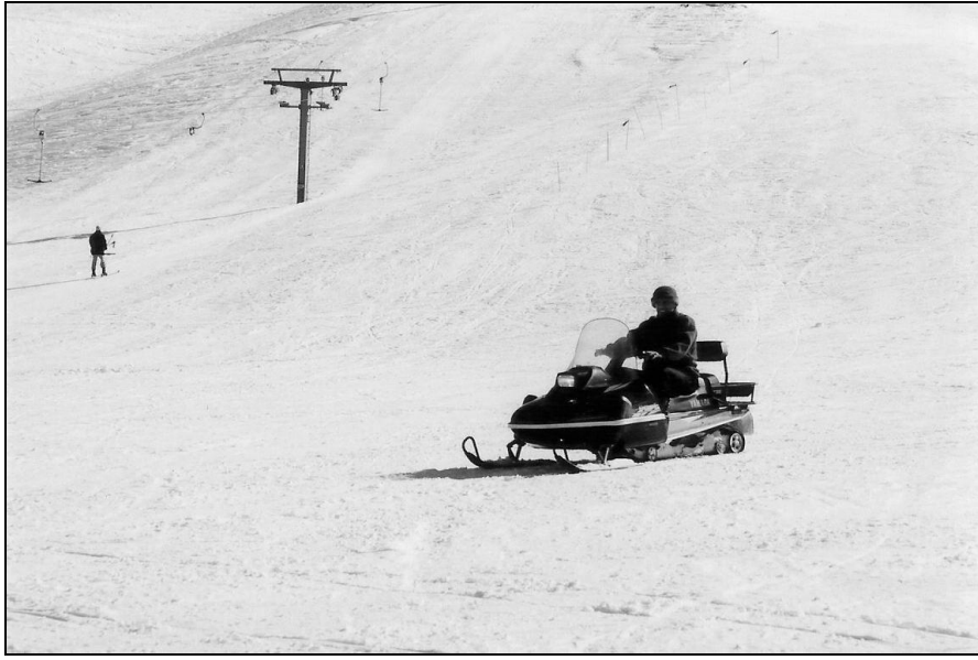
Foto 3. Hazar baba kayak merkezinde isteyen kayakçılara kiralanan, Kar motoruyla kayak yapan bir kişi

sezonunu 75-90 günle sınırlamakta, hatta bazı yıllar bu sürenin de çok altında kalmaktadır. Bu nedenle, Hazar Baba Kayak merkezi tek başına bir turizm yöreni olma özelliğinden ve yatırımları karşılama potansiyelinden uzaktır. Çevre alanı ve başka turizm faaliyetleri ile birlikte bir değer ifade etmektedir.