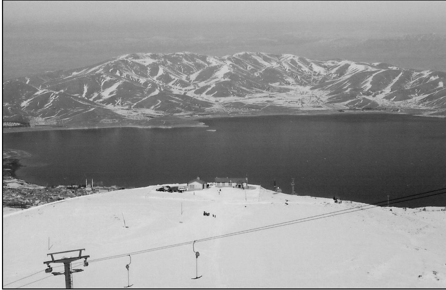
Foto 5. Kayak Merkezinden, Hazar Gölü Ve Çevresinin Görünüşü

Göl çevresinde başlangıçta kamu kurumlarının dinlenme tesisleri ile başlayan yapılaşma, çevre sakinlerinin katılımı ile tüm göl çevresini kaplamıştır. Elazığ, Diyarbakır ve Malatya illerinin sayfiye yeri durumundaki göl gerek Sivrice ilçe merkezinden, gerekse göl çevresindeki diğer sayfiye konutlarından kaynaklanan kirleticilerden olumsuz etkilenmiş ve etkilenmeye devam etmektedir. Gölden Hazar hidroelektrik santrallerine aşırı su verilmesi ile göl seviyesi düşmekte, çevredeki şiddetli erozyondan