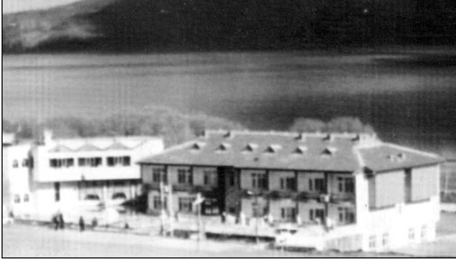
Foto 7. Sivrice Gölü Kıyısında Yer Alan, Kayak Merkezine 12 Km Uzaklıkta Bulunan Mavi Göl Tesislerinden Bir Görünüm

Ayrıca Fırat Üniversitesi, DSİ, Orman, Karayolları, Köy Hizmetleri Bölge Müdürlükleri, DD, TPAO, Elazığ Emniyet Müdürlüğü'nün ve Elazığ belediyesinin Hazar gölü kıyısında dinlenme ve konaklama tesisleri bulunmaktadır. Yaz aylarında faal olan bu tesisler, Hazar Baba kayak merkezine yoğun ilgi olursa, kış aylarında da turistlere hizmet verebilecek kapasiteye sahiptir.