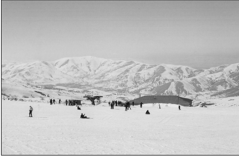
Foto 1. Hazar baba Kayak Merkezinden Genel bir Görünüm

Kayak merkezi Elazığ il merkezine 30 km. uzaklıktadır. Kara yolunun şehir merkezinden Sivrice'ye kadar olan bölümü asfalt ve oldukça düzgündür. Hazar gölünün kıyısında kurulan Sivrice ilçe merkezinden sonra, kayak merkezine doğru 6 km'lik bölümü kış mevsiminde yol stabilize olmasına rağmen ulaşımı zorlaştırmaktadır. Bazı günler ise yol ulaşımına kapanmaktadır. Bu 6 km'lik bölümün de asfaltlanması gerekmektedir.