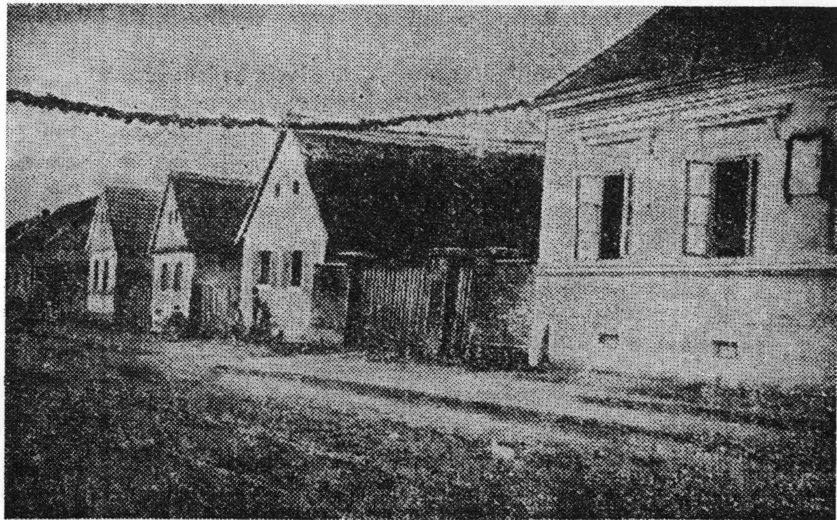
Fotografija ulice u Peterancu — prva na desno nalazi se rodna kuća Frana Galovića, na kojoj je spomen-ploča

Možda iz ove grupe tekstova valja posebno izdvojiti crtice: »Labuđa pjesma«, »Zapisci samotnika« i »Osama«, jer u njima se očituje piščeva sklonost melankoliji, pesimizmu, te izražavanju slutnji, straha, tjeskobnih intimnih proživljavanja, čežnje za nečim dalekim i nedorečenim. Sve pak navedene osobine karakteristične su za književna djela nastala u vrijeme moderne u Hrvatskoj. U ovim crticama, osim toga, možemo uočiti nagovještaj i najavu najznačajnijih Galovićevih djela kao što su »Zaćarano ogledalo« i »Ispovijed«. O tom intimističkom i ispovjednom tonu svjedoče i slijedeći citati: