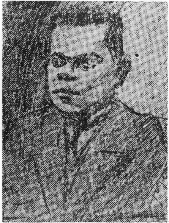
Fran Galović na crtežu Đure Tiljka iz 1913. godine — faksimil iz »Narodnog lista« od 21. srpnja 1946. godine

Uz navedene, još je nekoliko Galovićevih pripovijedaka s tematikom iz seoskog života, i pisanih realističnim stilom: »Prorok« u kojemu su uz seoski ambijent vezani vizionarni elementi (nepoznat čovjek kojega seljaci nazivaju »prorokom« najavljuje velike promjene i dolazak novog doba), »Nesreća«, pripovijetka u kojoj Galović povezuje socijalno i psihološko — smrt sina znači i socijalnu i psihološku tragediju za roditelje koji ostaju sami i pred njima se otvara bezdan siromaštva i propasti. Dok je u drugim pripovijetkama smrt element raspleta radnje, ovdje je smrt polazište, motiv na osnovu kojega pisac gradi svoje djelo. Osje-