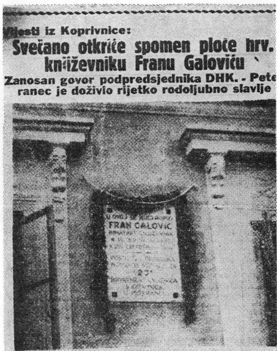
Faksimil iz »Jutarnjeg lista« od 14. rujna 1931. godine — fotografija uz članak u povodu otkrivanja spomen-ploče Franu Galoviću

»Zaćarano ogledalo« Galović je završio 14. travnja 1912. godine. To je njegova po opsegu najduža pripovijetka. Bilješka u kojoj je Galović zabilježio osnovni plan ove pripovijetke glasi: »Čovjek, koji poludi i gleda u zrcalo i vidi u njem čudne krajeve. Kad razbije zrcalo, umre.« 9 Ova pripovijetka predstavlja najopsežnije i najsloženije Galovićevo djelo. Marcel Petrović, proživljava svoju posljednju mjesečnu noć. U mističnoj atmosferi te noći, zbiva se prijelaz iz stvarnosti u san, iz života u smrt. U pogovoru knjige, u izdanju Društva hrvatskih književnika, pisalo je: »Galović je u njoj pokušao podati fantastičnu sliku prijelaza iz života u smrt. U ogledalu je simbol veze ovih