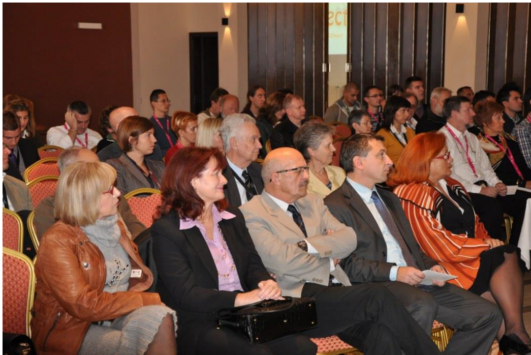
Sudionici simpozija Medicinska informatika 2011 u Varaždinu