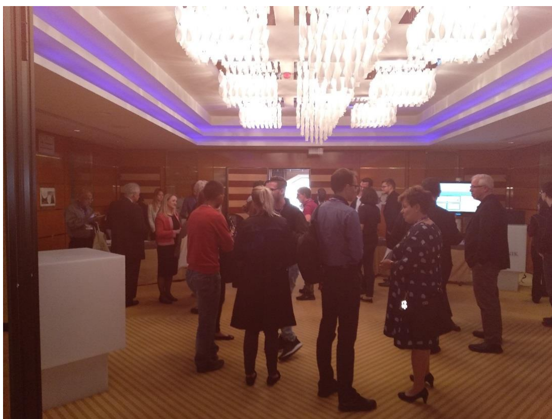
Sudionici konferencije EFMI STC 2018