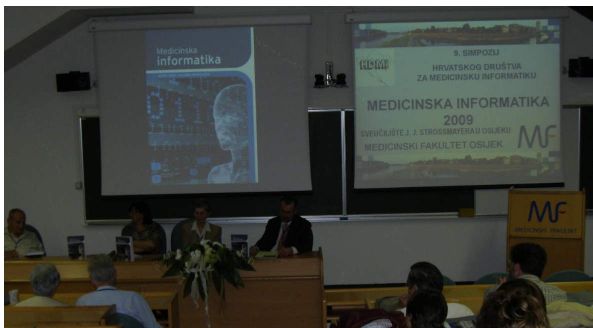
Simpozij MI2009 u Osijeku - predavljanje knjige "Medicinska informatika"

Drugi događaj koji je obilježio simpozij u Osijeku bio je predavljanje knjige "Medicinska informatika" (urednici: J. Kern i M. Petrovečki) u kojoj su svoje priloge dala 42 autora (13). Ovo je bila velika inovacija u hrvatskom medicinsko-informatičkom izdavaštvu, jer je to djelo poslužilo (a i danas još služi) kako u obrazovne, tako i u znanstvene i stručne svrhe.