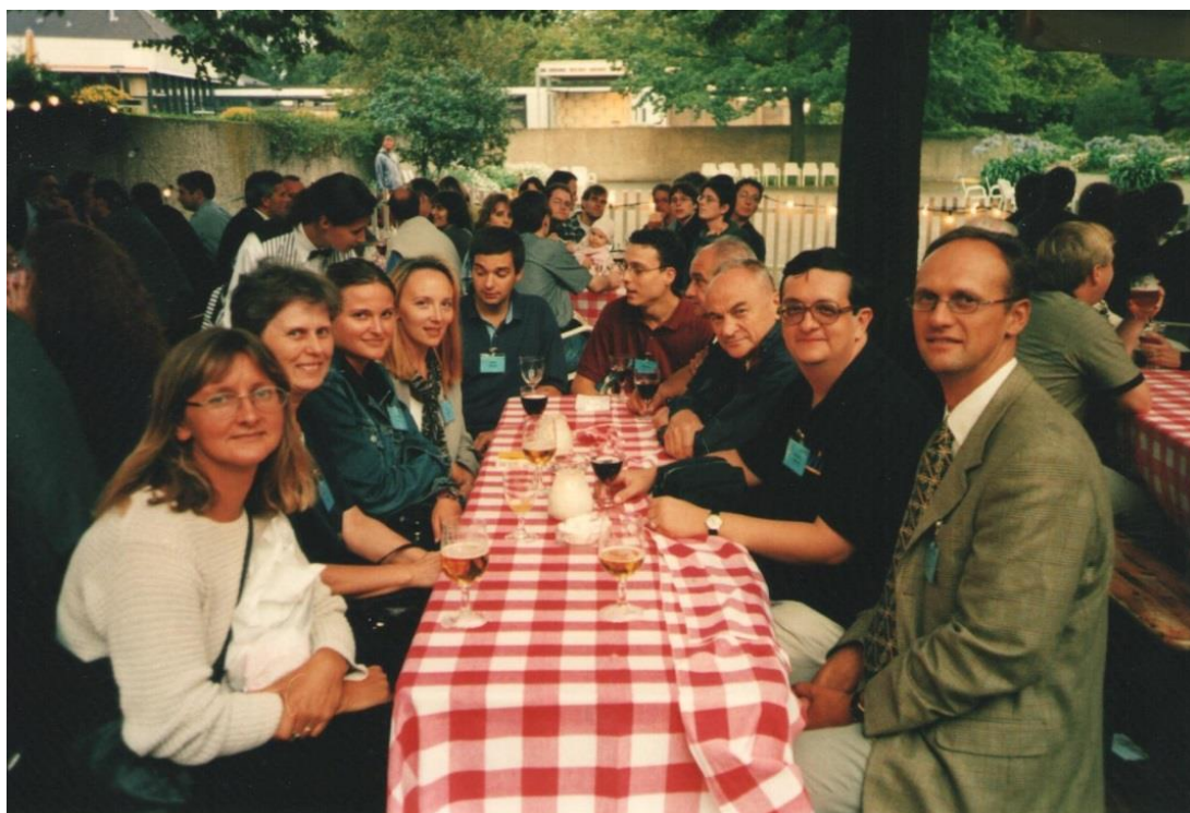
Članovi HDMI-a kao sudionici kongresa MIE2000 u Hannoveru