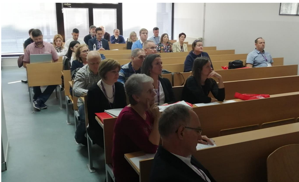
Sudionici drugog dana Simpozija