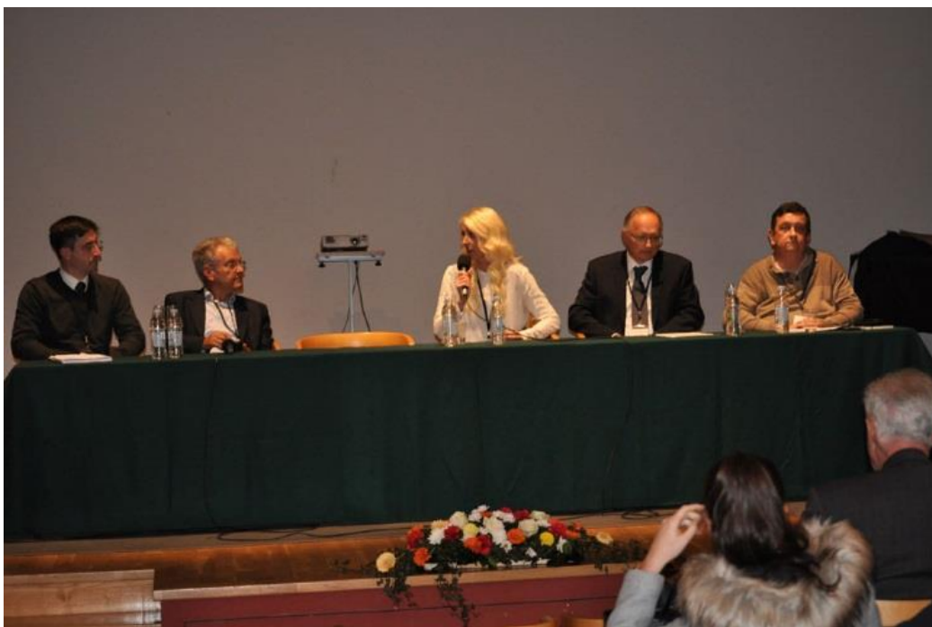
Sudionici okruglog stola " Sigurnost, zaštita i vlasništvo podataka u zdravstvu " održanog u sklopu MI2017

Ključni događaj za HDMI u godini 2018. bila je organizacija konferencije EFMI STC2018 „Sustavi za potporu odlučivanju i edukaciju – pomoć i potpora zdravstvenom sustavu“ koja se održala u Zagrebu u razdoblju od 14. do 16. listopada. Bio je to drugi međunarodni medicinsko-informatički skup u organizaciji Hrvatskog društva za medicinsku informatiku u Hrvatskoj. Detaljnije izvješće o konferenciji opisano je u Biltenu HDMI (17).