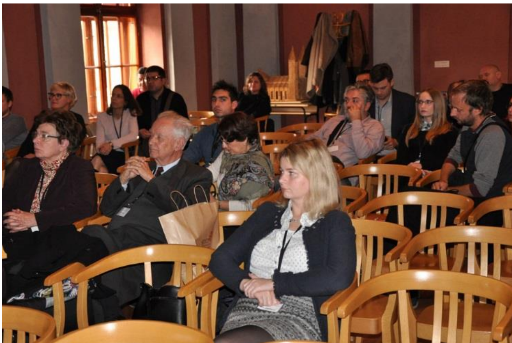
Sudionici 13. simpozija Hrvatskog društva za medicinsku informatiku MI2017 u Čakovcu