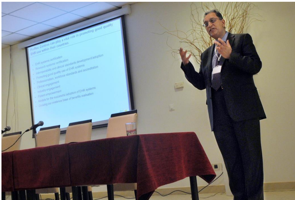
Simpozij MI2013 u Dubrovniku - Osnivačka skupština ProRec.HR (Dipak Kalra, predsjednik EuroRec instituta)

Simpoziju je prethodila treća međunarodna radionica ISHEP 2013 u sklopu koje je održana osnivačka skupština Hrvatske udruge za elektronički zdravstveni zapis ProRec.HR. Osnivačku skupštinu pozdravio je i Dipak Kalra, predsjednik EuroRec instituta.