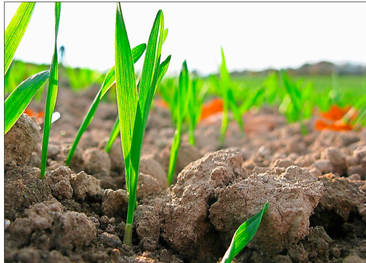
Für den Einsatz des Striegels im Getreide sollte das Saatbett nicht zu grob sein.

• Unkrautregulierung im Wintergetreide: In Getreide, das im Herbst bereits früh bestockt hat, ist eine Herbstbehandlung im frühen Nachauflauf zu empfehlen, was in Gerste meist der Fall ist. Die Körner sollten, damit die Herbstmittel nicht schaden, überall mit Erde bedeckt sein. Ein schnelles Auflaufen und eine gute Herbstbestockung durch nicht zu tiefe Saat ist aber besser. Die Pflanzen bilden dann auch schneller tiefere Wurzeln, die tiefer gehen als die Herbizidschicht. Walzen vor der Herbizidanwendung im Herbst erhöht die Wirkungssicherheit. Wenn in den letzten Jahren besonders beim Weizen hauptsächlich Frühjahrsbehandlungen mit B-Mitteln durchgeführt wurden, kann es sein, dass die Verunkrautung mit Ehrenpreis und Stiefmütterchen stark ist. Eine Herbstbehandlung schafft dann Abhilfe, weil andere Wirkstoffgruppen als im Frühjahr zum Einsatz kommen. Die Herbstbehandlung beugt der Resistenzbildung vor. Bei einem hohen Ackerfuchsschwanzdruck sollte eine Unkrautbehandlung unbedingt