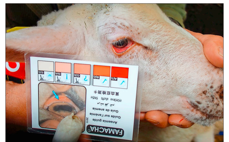
Bleiche Lidbindehäute können eine Infektion mit dem Gedrehten Magenwurm aufzeigen.