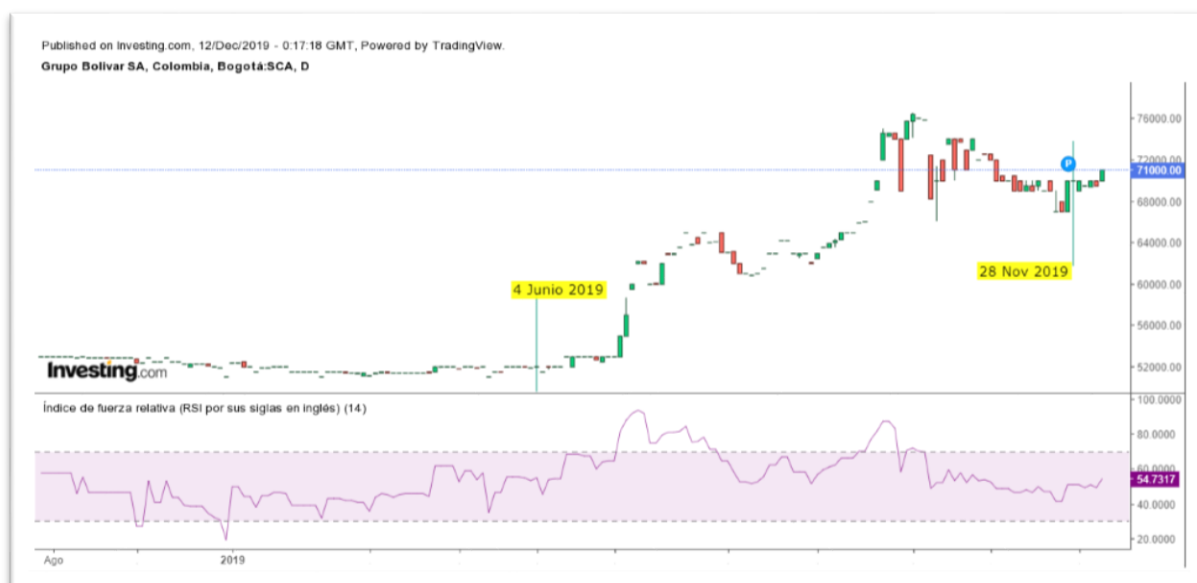
Gráfica 2 Índice de Fuerza Relativa del Título GRUBOLIVAR

Nota: Comportamiento del título GRUBOLIVAR desde el 04 de junio al 28 de noviembre de 2019.