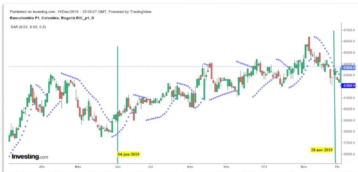
Gráfica 10 Parabolic SAR del título PFBCOLOM

Nota: Comportamiento del título PFBCOLOM desde el 04 de junio al 28 de noviembre de 2019.