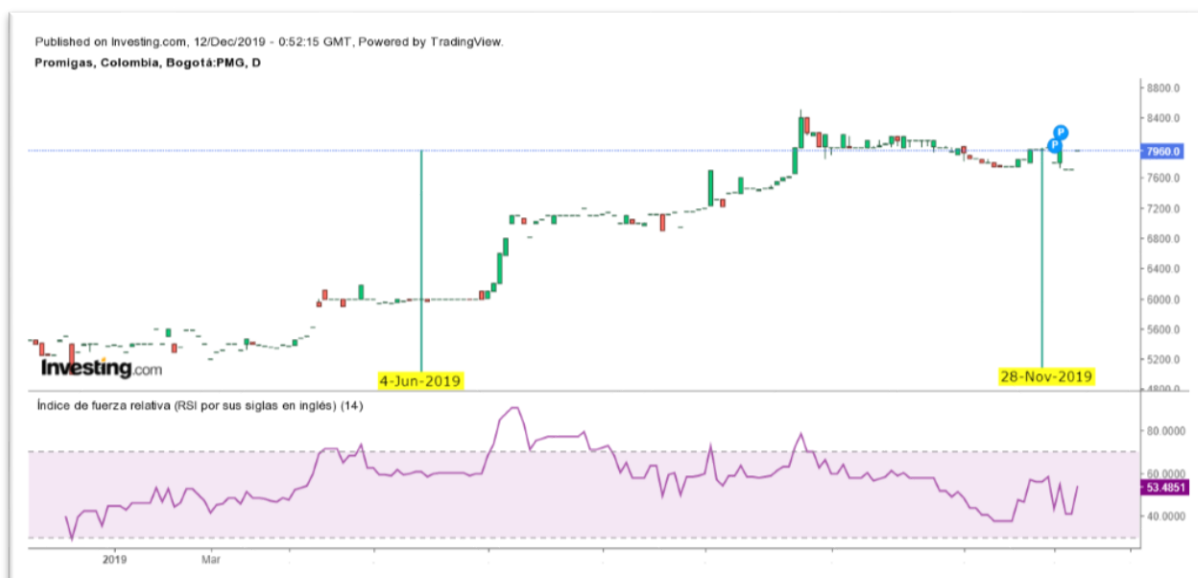
Gráfica 7 Índice de Fuerza Relativa del Título PROMIGAS

Nota: Comportamiento del título PROMIGAS desde el 04 de junio al 28 de noviembre de 2019. Desde el 04 de junio al 28 de noviembre 2019.