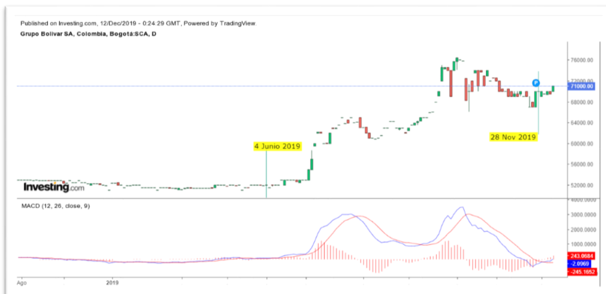
Gráfica 4 Media Móvil de Convergencia y Divergencia del Título GRUBOLIVAR

Nota: Comportamiento del título GRUBOLIVAR desde el 04 de junio al 28 noviembre de 2019.