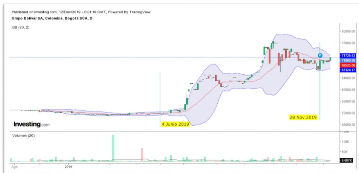
Gráfica 1 Bandas Bollinger del Título GRUBOLIVAR

Nota: Comportamiento del título GRUBOLIVAR desde el 04 de junio al 28 de noviembre de 2019.