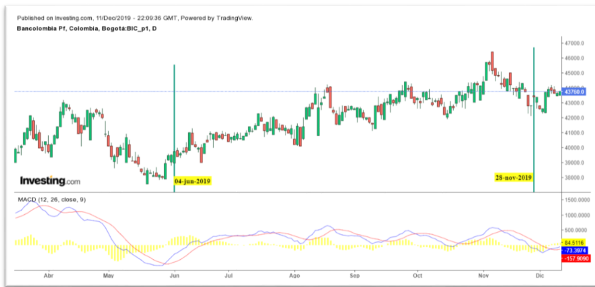
Gráfica 11 Media Móvil de Convergencia y Divergencia del título PFBCOLOM

Nota: Comportamiento del título PFBCOLOM desde el 04 de junio al 28 de noviembre de 2019.