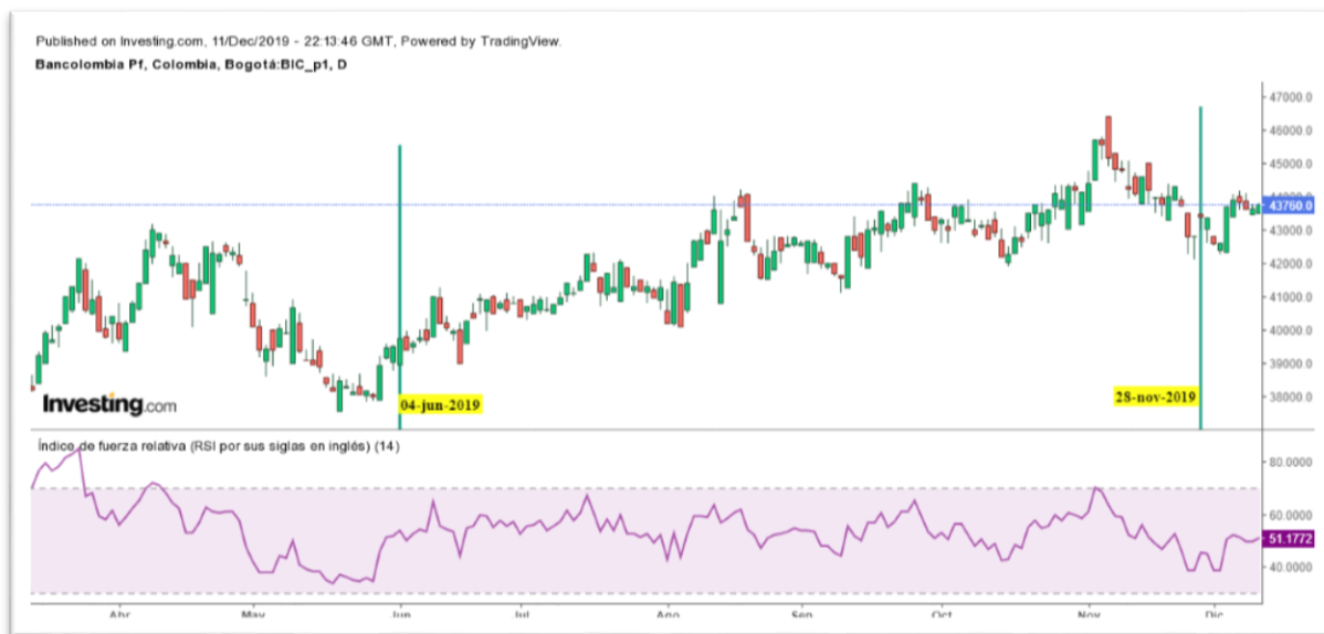
Gráfica 12 Índice de fuerza relativa RSI del Título PFBCOLOMB

Fuente: Tomada del gráficador de Investing. Nota: Comportamiento del título PFBCOLOM desde el 04 de junio al 28 de noviembre de 2019.