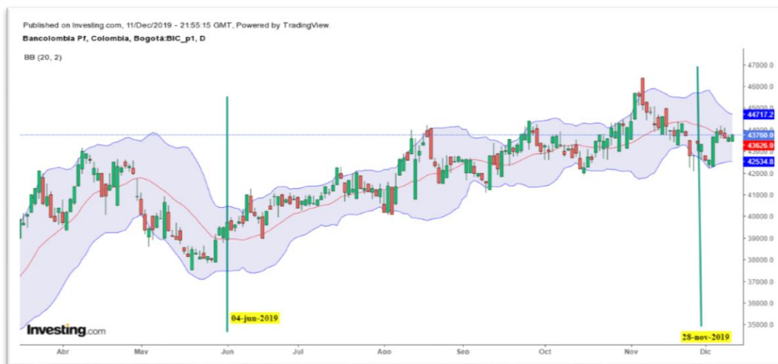
Gráfica 9 Bandas Bollinger del Título PFBCOLOM

Nota: Comportamiento del título PFBCOLOM desde el 04 de junio al 28 de noviembre de 2019.