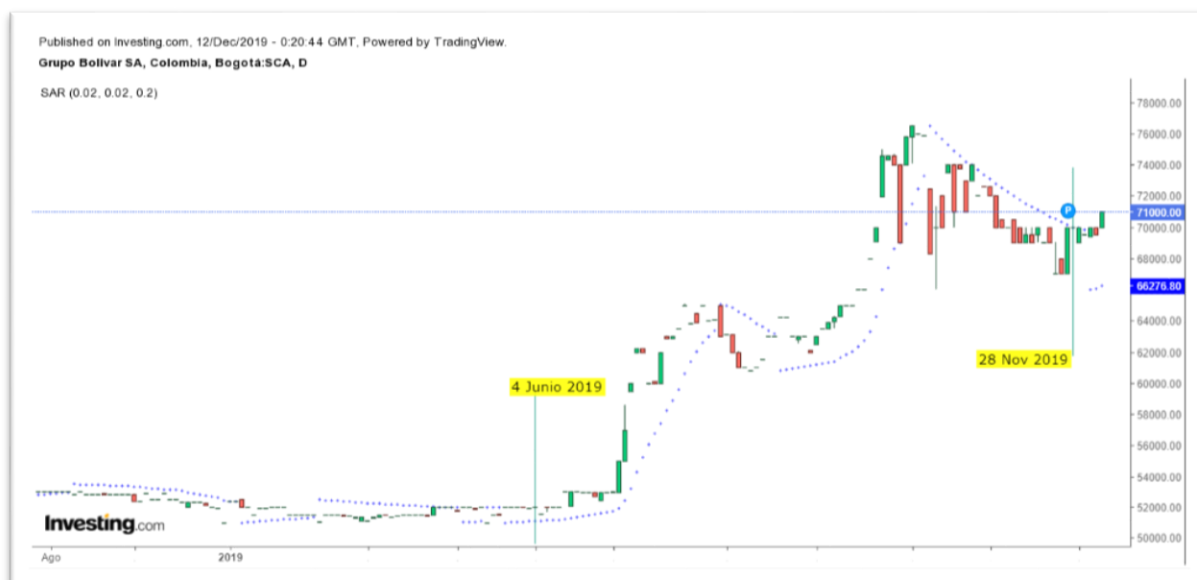
Gráfica 3 Parabolic SAR del Título GRUBOLIVAR

Nota: Comportamiento del título GRUBOLIVAR desde el 04 de junio al 28 de noviembre de 2019.