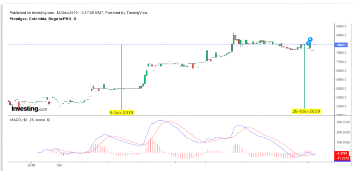
Gráfica 6 Media Móvil de Convergencia y Divergencia del Título PROMIGAS

Nota: Comportamiento del título PROMIGAS desde el 04 de junio al 28 de noviembre de 2019.