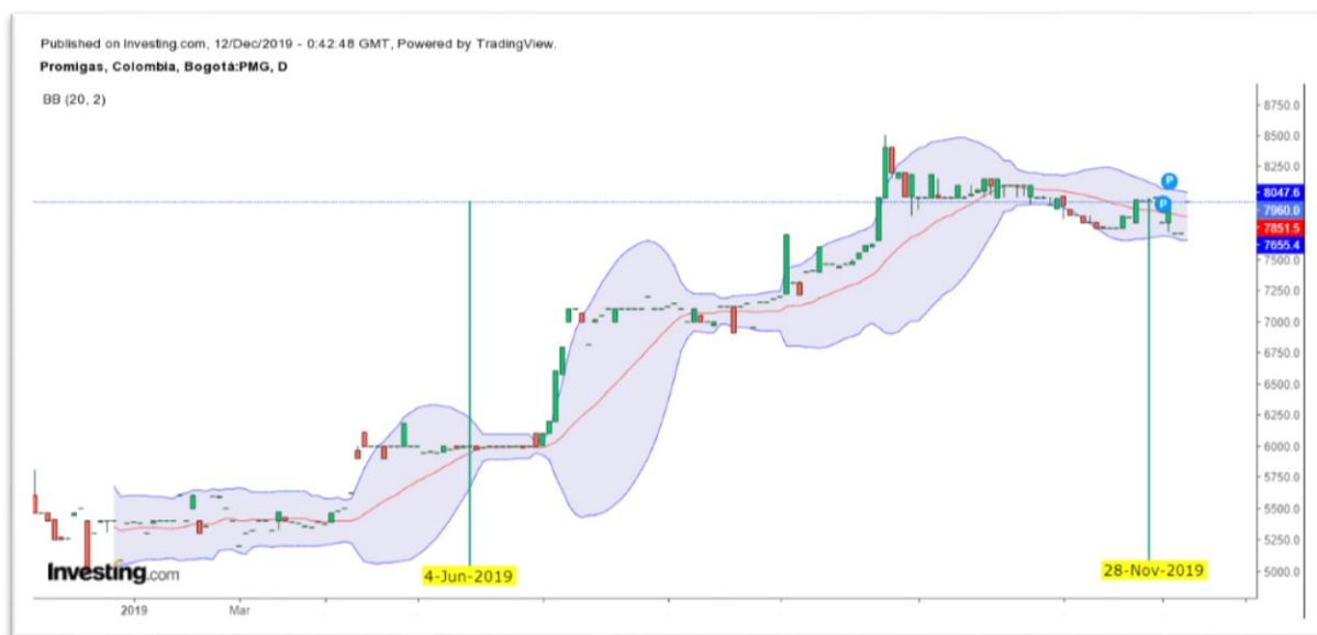
Gráfica 5 Bandas Bollinger del Título PROMIGAS

Nota: Comportamiento del título PROMIGAS desde el 04 de junio al 28 de noviembre de 2019.