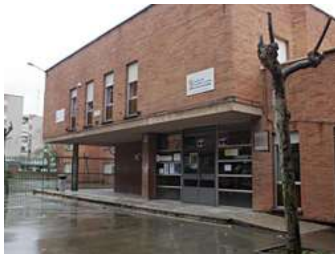
Imagen 5-1 CEIP Antonio Allúe Morer, Valladolid

“El colegio es una burbuja. Se les llama 2030, antigua tipología de colegios de difícil desempeño. Tienen un contra añadido, el alumnado. El 70% son minorías étnicas y, a priori, puede haber casos problemáticos. Pero, comparado con otros colegios de la misma tipología, estamos por debajo en incidentes, con datos equiparables a colegios públicos o concertados” (E6, p.1).