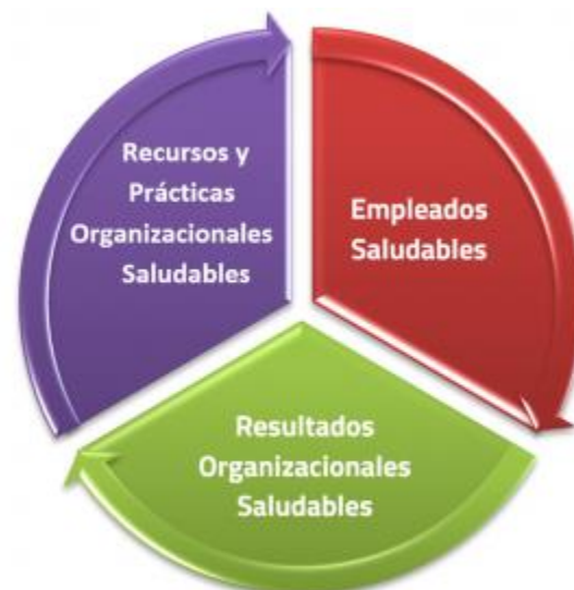
(HERO – Salanova et al., 2012. GOM)

El model HERO constitueix un model heurístic i teòric que permet integrar resultats basant-se en evidència teòrica i empírica que prové de les investigacions sobre estrès laboral, DRH, comportament organitzacional i des de la Psicologia de la Salut Ocupacional Positiva (Llorens, Del Líbano i Salanova, 2009). D'acord amb aquest model, una organització saludable i resilient combina tres components clau que interaccionen entre si, i que son (1) recursos i pràctiques organitzacionals saludables, (2) empleats saludables i (3) resultats organitzacionals saludables.