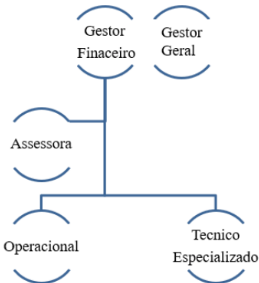
Figura 3 Organograma

O nicho de mercado da organização é a revenda, ou seja a empresa vende para o consumidor intermediário, este funciona como elo comercial da empresa. Segundo a tabela de preços os descontos são adaptados ao tipo de vendas, bem como, à quantidade que o cliente compra. Esta é uma estratégia de negócio adotada de modo a não ser necessário um funcionário comercial interno- os descontos para o cliente, sobre a tabela, apresentam mais rentabilidade e menos custos fixos para a empresa.