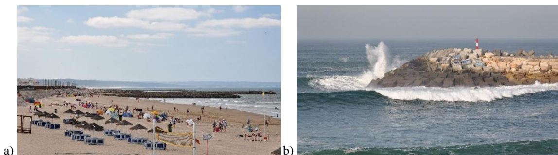
Fig. 2. a) Costa da Caparica; b) Porto da Ericeira