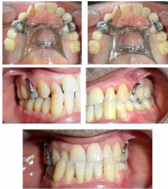
Figura 15. Instalación definitiva de la prótesis parcial removible, hay adecuada restitución de la forma, estética y función Figure 15. Definite insertion of removable partial prosthesis with adequate restitution of form, esthetics and function