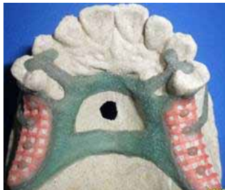
Figura 11. Encerado del diseño de la prótesis parcial removible Figure 11. Waxing of the removable partial prosthesis design

Teeth alignment was then performed and tested on the patient (figure 14); acrylic was added on the structure and the patient's mouth was examined again. Satisfactory results were achieved in compliance with clinical criteria and patient's perception (figure 15). Finally, three follow-up appointments for prosthesis control were scheduled.