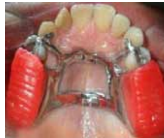
Figura 12. Colado de la estructura metálica y prueba en boca Figure 12. Casting of metallic structure and test in mouth