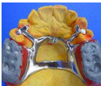
Figura 13. Registro oclusal con cera alúmina sobre rodetes Figure 13. Occlusal registration with aluminum wax on rings