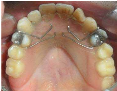
Figura 6. Instalación de placa estética superior temporal Figure 6. Installation of temporary upper esthetic plate

Reassessment was performed eight weeks after periodontal disinfection—the required period for healing of periodontal tissues—. 29 This step included: evaluation of oral tissues, construction of a new periodontogram (figure 7), and completion of a new periapical radiographic series (January 16 th 2012) (figure 8).