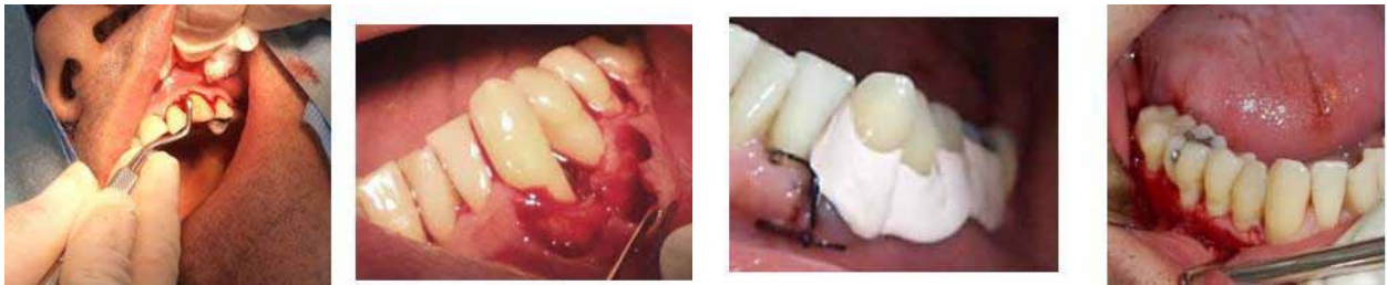
Figura 9. Acceso quirúrgico para raspaje y alisado radicular en cuadrantes II, III y IV