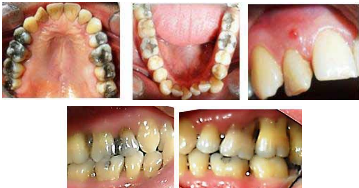
Figura 1. Imágenes intraorales iniciales

A complete clinical history was registered, and several diagnostic aids were performed, such as clinical photographs, periapical radiographic series (figures 1, 2 and 3), and study models. The principal findings include: the patient is systemically healthy, with family history of periodontal disease, high blood pressure, diabetes, and dental prosthesis; the functional analysis of the temporomandibular joint revealed a slight block by the end of oral opening followed by a dull noise and a sudden movement. The patient has had history of articular noise and a joint block on maximum opening. He admits brushing his teeth daily at least twice a day and not using dental floss very often. A fistulous tract was observed at the level of tooth 12 (figure 1), as well as soft and hard dentobacterial plaque, dental mobility degree 1 and 2 at 16, 17, 26, 27, 28, 33, and 34, gingival retractions with positive bleeding clinical indexes (30%), inflammation, suppuration, probing depth, and loss of clinical insertion. It is important to point out the presence of lower anterior dental crowding as a local risk factor that favors bacterial plaque accumulation 20,21 (figure 1). The radiographic analysis showed generalized bone loss in both vertical and horizontal directions, and a significant periapical lesion on tooth 12 (figure 2).