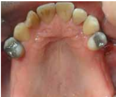
Figura 4. Exodoncia de los dientes posterosuperiores con pronóstico periodontal malo

Se ejecutaron varios procedimientos clínicos dentro del periodo higiénico, cuyo fin fue detener la infección periodontal y enseñar al paciente a mantener una higiene bucal adecuada, esto incluyó: educación y motivación del paciente en salud bucal, ambientación periodontal supragingival con scaler y curetas, profilaxis dental con cepillo y pasta profiláctica, exodoncia simple para dientes con pronóstico periodontal malo: 16, 17, 18, 26, 27, 28 (figura 4), eliminación de caries activa del 47, desbridamiento pulpar y endodoncia del 12, ambientación periodontal subgingival a boca completa (desinfección total de la boca) 28 que incluyó: raspaje y alisado radicular no quirúrgico con curetas y aparato sónico-scaler para eliminar los irritantes subgingivales y desorganizar la flora bacteriana adherida y no adherida. 5, 29 (figura 5).