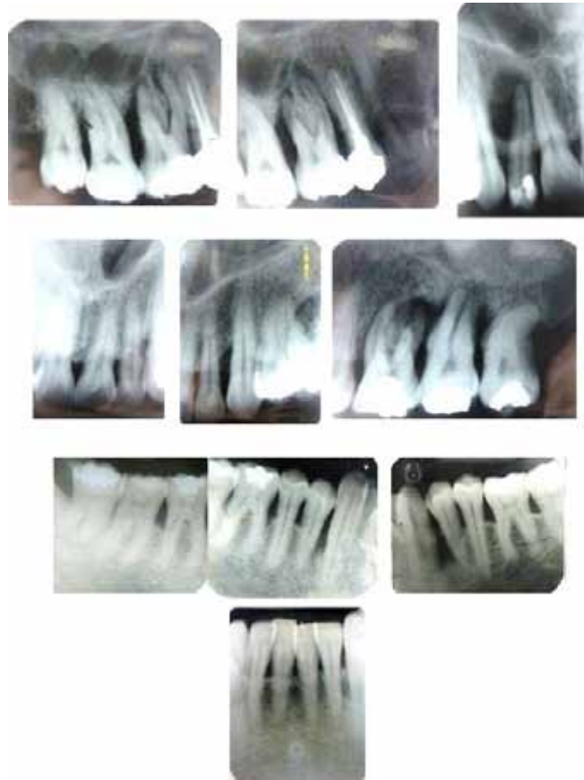
Figura 2. Serie radiográfica periapical de diagnóstico inicial