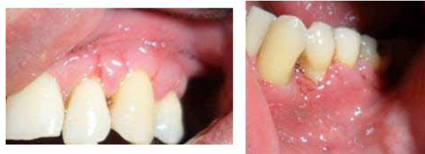
Figura 10. Control postoperatorio a los ocho días, cicatrización en curso y sin signos de infección