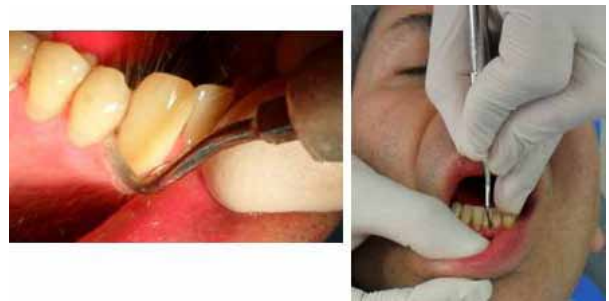
Figura 5. Desinfección total de la boca: raspaje y alisado radicular con curetas de gracey y scaler

Several clinical procedures were performed during the hygienic phase in order to stop periodontal infection and to teach the patient how to maintain good oral hygiene; this included: patient's motivation and education on oral health, supragingival periodontal preparation with scalers and curettes, dental prophylaxis with toothbrush and prophylactic paste, simple extraction for teeth with bad periodontal prognosis: 16, 17, 18, 26, 27, 28 (figure 4), removal of active caries on 47, pulpal debriding and endodontics of tooth 12, subgingival periodontal preparation to entire mouth (total mouth disinfection) 28 which included: non-surgical scaling and root planing with curettes and sonic-scaler machine to remove subgingival irritants and disorganize adhered and non-adhered bacterial flora. 5, 29 (figure 5).