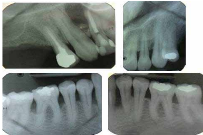
Figura 8. Serie radiográfica de reevaluación, se observa llenado óseo en mesial del 23 y corticación de cresta ósea en general