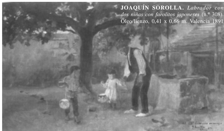
JOAQUÍN SOROLLA. Labrador con dos niñas con farolitos japoneses (n.º 308). Óleo/lienzo, 0,41 x 0,66 m. Valencia 1891

Cuando mejoró el apetito de los niños y se controló la infección se inició la fase de rehabilitación. Se sustituyó la F-75 por una cantidad equivalente de F-100 durante 2 días. Después del segundo día se incrementó la ingesta en 10 ml por cada toma de alimento hasta cuando el niño empezó a dejar residuo constante.