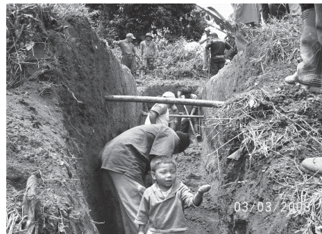
Figura 1. Juego-trabajo en la minga.

Un conjunto de actividades realizadas por la comunidad como prácticas de juego en el gran territorio, son las acciones propias de su cotidianidad, como las funciones emprendidas para resolver las necesidades colectivas (la minga) y las actividades que garantizan el asociacionismo, la unidad y la integración (las asambleas, la minga y la participación en organizaciones comunales). En la minga se destaca el espíritu de entrega a la labor y a los procesos de integración que allí se dan, como la chanza, la ‘conversa’, el alimento, la bebida y el baile, todas posibilidades humanas de reconocimiento y afianzamiento de la confianza y del disfrute como forma de existir en el mundo.