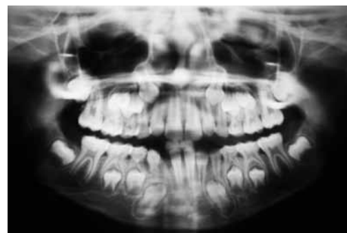
Figura 4. Radiografía panorámica que muestra un caso de transposición unilateral del lado derecho del canino mandibular y el incisivo lateral, persistencia del canino temporal

Figure 3. Panoramic radiograph showing a case of unilateral transposition at the left side involving the maxillary canine and the second premolar, with persistence of the temporary canine and agenesia of 37