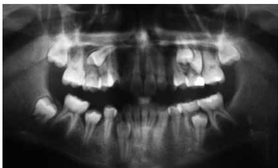
Figura 3. Radiografía panorámica que muestra un caso de transposición unilateral del lado izquierdo del canino maxilar y el segundo premolar, persistencia del canino temporal y agenesia del 37

Figure 2. Panoramic radiograph showing a case of unilateral transposition at the right side involving the maxillary canine and the lateral incisor, and persistence of the temporary canine