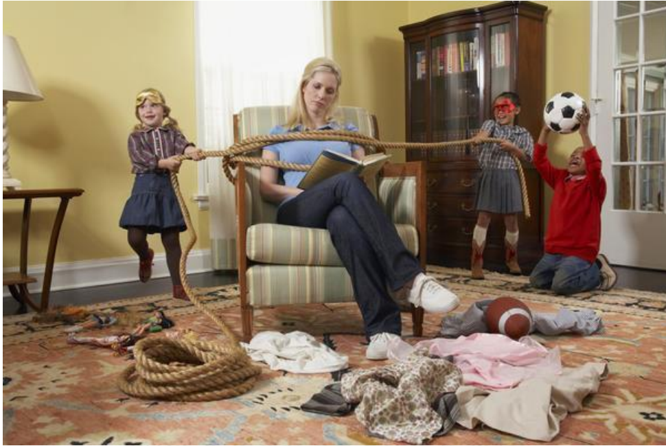
Imagen 15. Educación