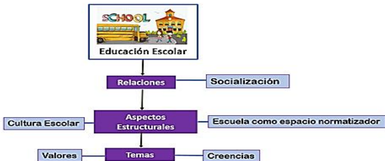
Figura 2. Aspectos de la educación.