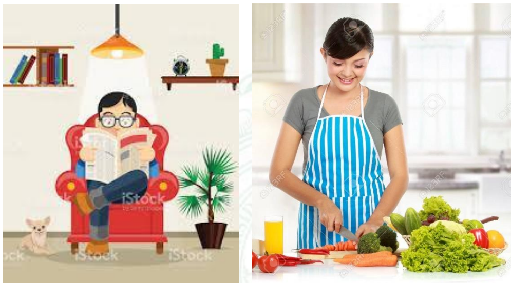
Imagen 3. Facultad de Educación