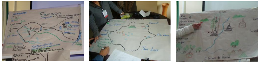
Ejemplo de los mapas mentales realizados por los docentes en los talleres.

En los mapas logrados por los docentes de la subregión, se muestra el territorio de existencia física y real desde el significado sociocultural, el espacio social, con una existencia subjetiva y colectiva, con diversos significados a través de los cuales lo real-objetivo es filtrado y se entremezcla con sensaciones, emociones, estereotipos, etc. Pero además, son representaciones pensadas en el contexto del estudio de los lugares desde el aula, es decir con una intencionalidad didáctica.