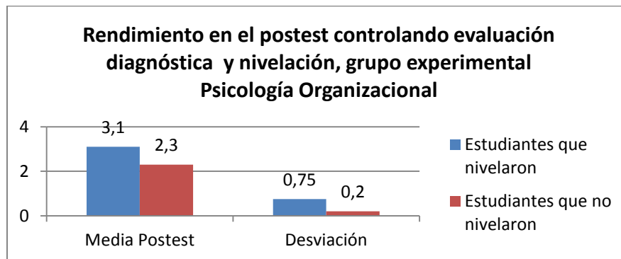
Gráfico 3. Rendimiento en el postest controlando evaluación diagnóstica y nivelación, grupo experimental Psicología Organizacional.

3.27, con una desviación de 1.18. La prueba t arroja un valor de 0.48, con una probabilidad de error 0.63, lo cual no permite rechazar la hipótesis nula. Hay que tener presente que en este caso, el grupo control no actuó en el mismo simultáneamente con el grupo experimental, sino que se tomaron los datos de la misma materia de un semestre anterior. Debe anotarse, también, que la evaluación del grupo control se hizo con base en el portafolio anterior, menos exigente.