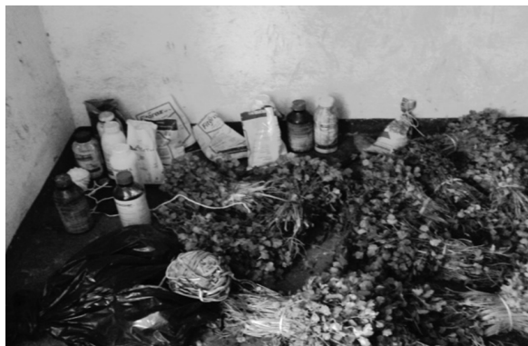
Figura 2. Almacenamiento de agroquímicos junto a cosecha de cilantro en un predio (Marinilla, 2011-2012)

los encuestados sobre los riesgos asociados a la manipulación de agroquímicos, se encontró que el 58% los conocían, principalmente la intoxicación (47%).