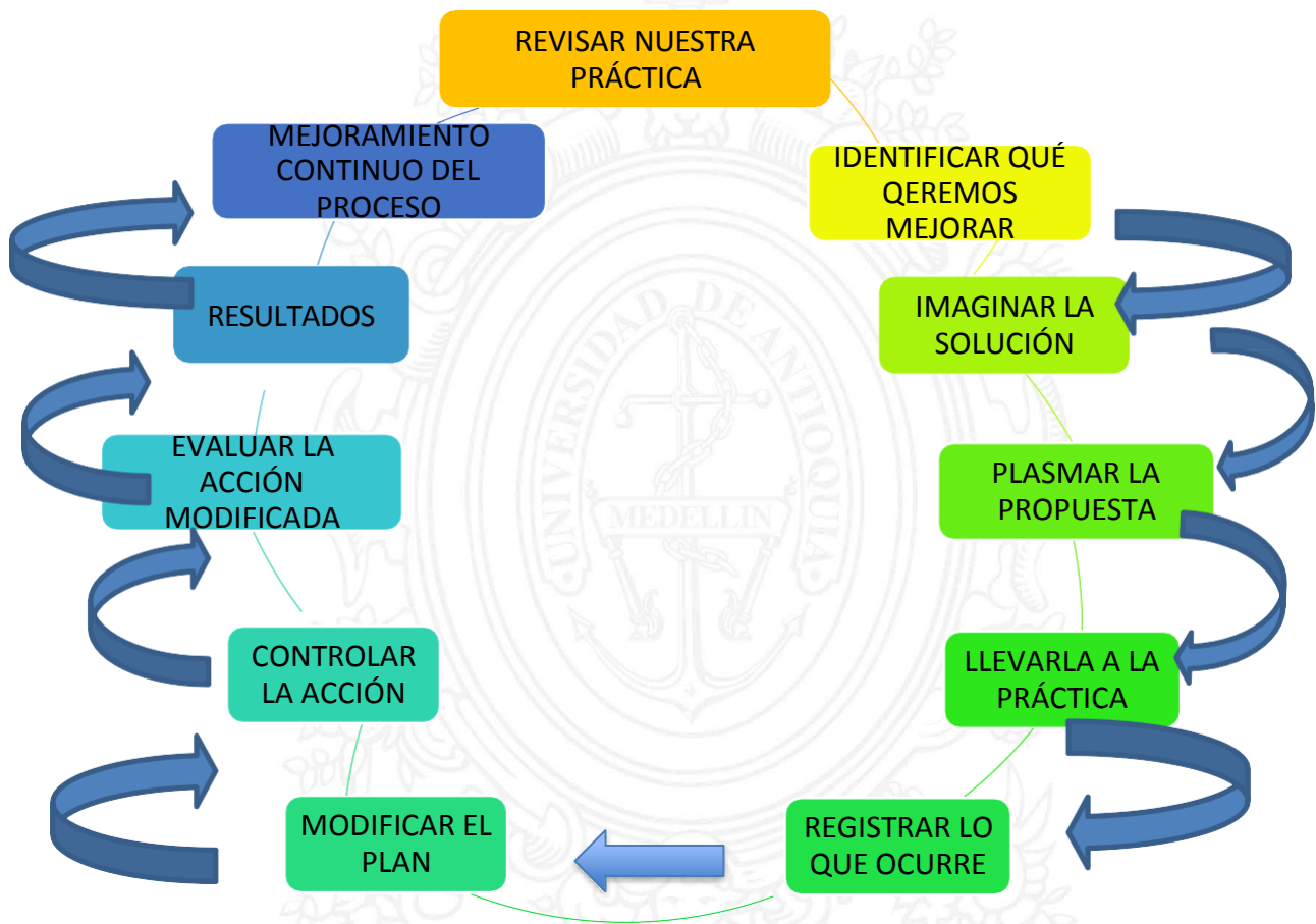
Ilustración 3 Mapa relacional entre las prácticas según McNiff y otros (1996) (elaboración propia).

El Contexto de la Investigación Acción Educativa, está enmarcado dentro del aula como un espacio de reflexión e investigación de nuestras propias prácticas educativas con miras a trascender otros espacios más amplios como el social, el político y el cultural. Partiendo de ese análisis, se concibe como una herramienta de desarrollo profesional docente donde los conocimientos generados por otros, la autonomía de la práctica educativa, la toma de decisiones y la implementación de nuevas acciones son la razón de ser de la investigación ya que generan cambios y transformaciones con miras a mejorar la calidad de la educación.