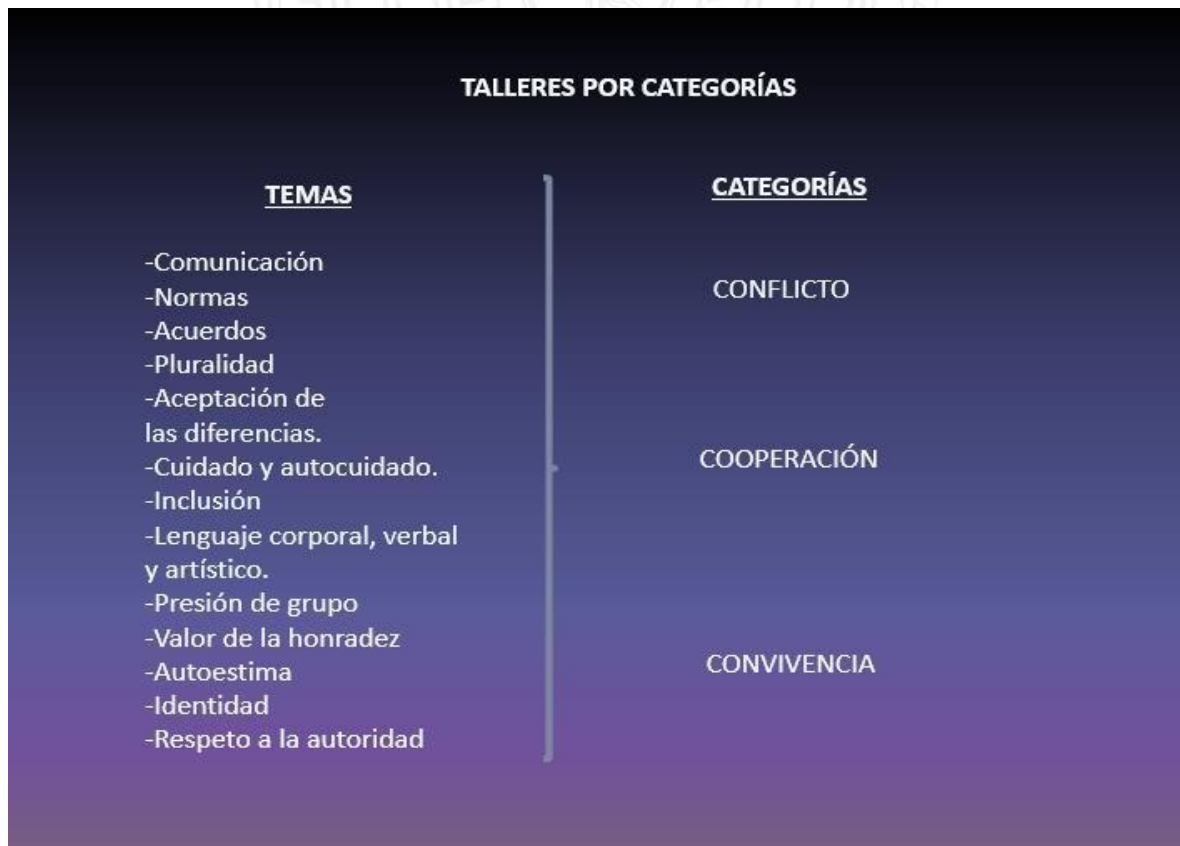
Ilustración 4 Creación propia. Relación temas-Categorías-Competencias

En este capítulo se pretende dar respuesta al primer objetivo específico planteado 4 con el análisis de los hallazgos encontrados a partir de la realización de los talleres de la unidad didáctica y de la observación que realizamos como maestros interventores. Para ello organizamos los resultados en tres categorías principales: conflicto, cooperación y convivencia y en cada una de ellas está organizada la información de acuerdo con los temas de los talleres que se aplicaron en la unidad didáctica. Recordemos que para cada categoría principal se desarrollaron varios temas y de cada tema surgió un taller.