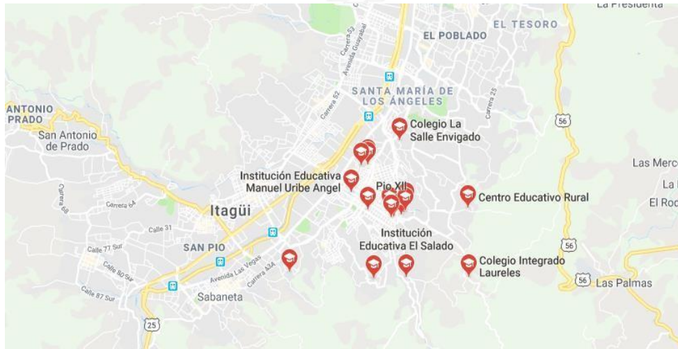
Ilustración 1. Ubicación IE Manuel Uribe Ángel y Pío XII. Mapa extraído de Google abril 6 de 2018.

Debido a los comportamientos antes mencionados, se contemplan los aportes que brinda el Manual de Convivencia en cada institución y que hace frente al manejo de situaciones de conflicto entre otros dispositivos organizacionales: Es así como, el Manual de Convivencia de la escuela Pío XII se constituye en un instrumento regulador de las relaciones que al interior de la Institución se vivencian con miras a formar para la democracia y la paz. (Manual de Convivencia IE Comercial, 2016, pág.6). En la IE Manuel Uribe Ángel, el Manual de Convivencia y los proyectos pedagógicos inscritos en el Proyecto Educativo Institucional, desarrollan competencias ciudadanas orientadas a fortalecer el clima escolar y el crecimiento integral de quienes hacen parte de la comunidad educativa. (Manual de Convivencia IE MUA, 2016, pág.24). Cada estudiante debe portar consigo el Manual y tener conocimiento sobre las disposiciones que se tienen en cuenta para casos de estímulo, reconocimiento, amonestación, sanción y expulsión, entre otros aspectos relevantes, (reconocimiento de deberes y derechos).