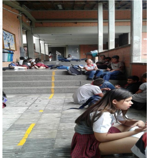
Fotografía (Niños, sede Pio XII, grado 3°. 2017) Fotografía (Niños MUA, grado 6.1, 2017)