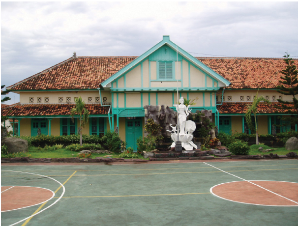
Gambar 2. Gedung bekas MULO, sekarang menjadi SMP 1 Singaraja.

no. 109, Kelurahan Banjar Bali, Kecamatan Buleleng (gambar 2). Pada tahun 1946-1958,