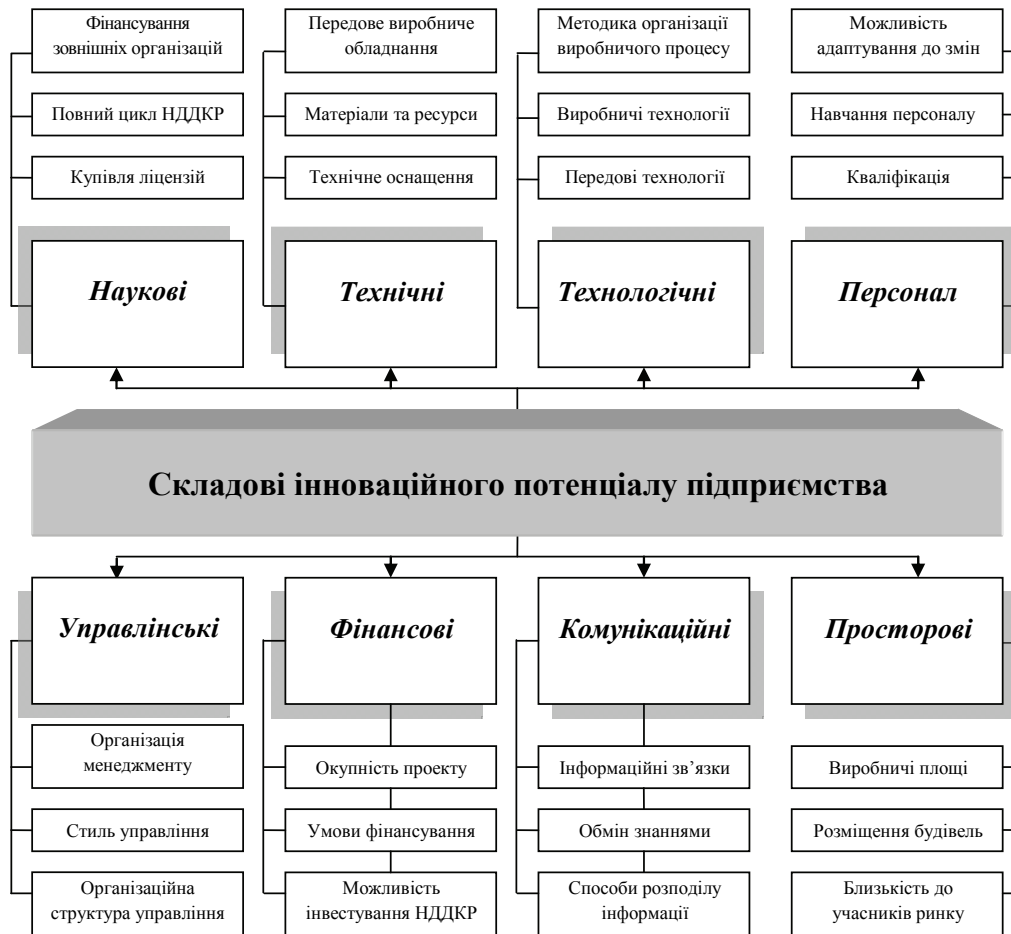
Рис. 1. Складові внутрішнього інноваційного потенціалу для забезпечення конкурентоспроможності підприємства [складено авторами на основі [3, с. 140-148]]