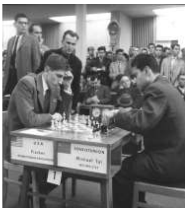
Mihails Tāls un Bobijs Fišers 1960. gada olimpiādē.