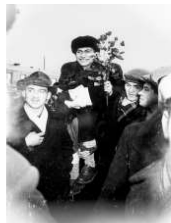
Mihails Tāls - pasaules čempiona sagaidīšana Rīgā 1960. gadā.