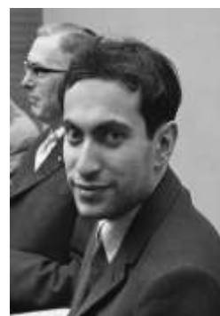
Mihails Tāls.

Beidzis Latvijas Valsts universitāti. 1960.-1970. gadā bija žurnāla "Šahs" galvenais redaktors.