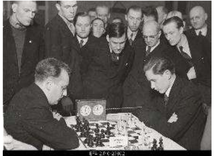
Vladimirs Petrovs (no kreisās puses) pret Igaunijas lielmeistaru Paulu Keresu, draudzības mačs starp Igauniju un Latviju 1938.gadā.

1926. gadā viņš ieguva pirmās vietas 1. Rīgas meistarsacīkstēs un Latvijas Šaha kluba meistarsacīkstēs un pārsvarā nodevās šaha spēlei.