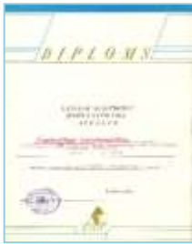
Diploms LU sieviešu komandai par iegūto 1. vietu Latvijas 1. Universiādē, 1991. gads

1992. gadā LU komanda iegūst 1. vietu vīriešu un sieviešu grupā Latvijas Universiādē. Laika posmā no 1993. līdz 1997. gadam LU komanda uzvar Latvijas Universiādē. 1996. gadā LU komanda pirmo reizi iegūst Latvijas čempionu titulu. 1998. gada LU komanda iegūst 3. vietu Eiropas kausa izcīņas priekšsacīkstēs, kā arī LU komandai otro reizi 1. vieta Latvijas komandu čempionātā.